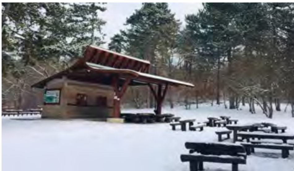
Gyenesdiás télen is gyönyörű! Ezeket a csodás képeket a Turisztikai Egyesület Instagram oldalán követhetik nyomon. ( https://www.instagram.com/gyenesdias/ )

Az elmúlt és előttünk álló hetek nehézségeit