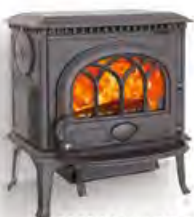
F3 CB fekete színben

"Clean burn" kétszeres égetés rendszerű öntöttvas kályha "Air wash" rendszerrel, mely az üveget tisztán tartja. A zománczott felület egyszerűbbé teszi a karbantartást, megóvja a felületet a rozsdásodástól, évről-évre megőrzi a kályha fényét.