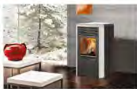
Edilkamin Point 2 fehér kerámia fedlap és oldal profil

Magyarország legkedveltebb Pelletkályhája. A készülék egy napi tárolóval rendelkezik amibe kb. egy zsák pellet tölthető, ami így 1-2 nap üzemelésre ad lehetőséget.