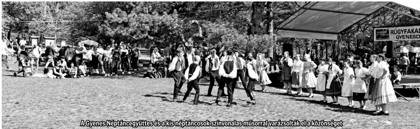
A Gyenes Néptáncgyűttes és a kis néptáncosok színvonalas műsorral varázsolták el a közönséget

A szakmai és civil zsűri idén – az ÁSZOK csapatának – Csülkös káposzta gombóccal nevű főztjét ítélte a legjobbknak és a legízesebbnek, így ők vitték el idén az ezüst vándorserleget. Szorosan az első helyezett után következett még 2 kategória győztes, kiemelt arany minősítéssel; ezek a 379. sz. Feltámadás Cserkészcsapat – Tócsni tekerse , valamint a Rezi Várbarátok – Körömpörköltje csülökhússal főztje voltak. Szoros volt a mezőny, mert kiemelt arany minősítéssel szoroson követték a többiek is az elsőt, igazán exkluzív, szinte éttermi minőségű ételek repertoárjával. Kiemelt arany érmet lett a soron következő 9 csapat is, mint a „ LEGYEN A BALATON FRÖCCS ” csapata – a