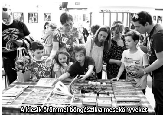
A kicsik örömmel böngészik a mesekönyveket