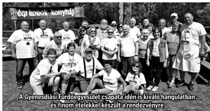
A Gyenesdiási Fürdőegyesület csapata idén is kiváló hangulatban és finom ételekkel készült a rendezvényre