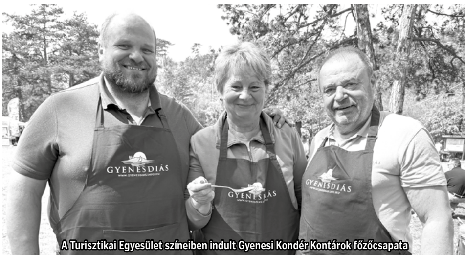
A Turisztikai Egyesület színeiben indult Gyenesi Kondér Kontárok főzőcsapata

A korábbi évek gyakorlatához hasonlóan a tavaszi hónapok a szezonra történő intenzív felkészüléssel teltek. Több nyomdai kiadványunk is megújult , amelyek immár elérhetőek a Tourinform Irodában. A sort szokásunkhoz híven a 2026-os rendezvénytárrunk nyitotta, amely magyar, német és angol