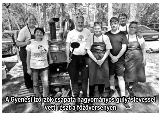
A Gyenesi Ízőrzők csapata hagyományos gulyáslevesrel vett részt a főzőversenyen