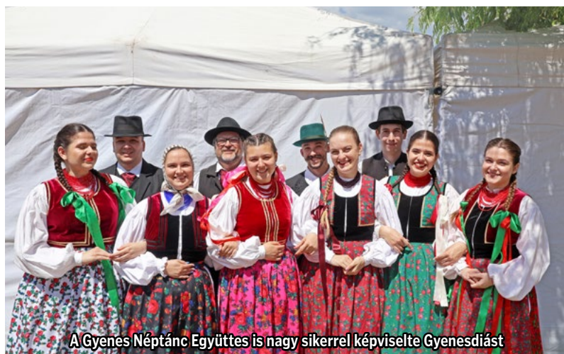
A Gyenes Néptánc Együttes is nagy sikerrel képviselte Gyenesdiást