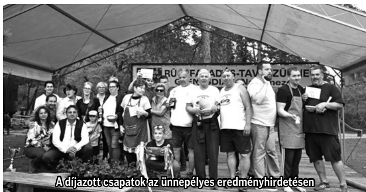
Adíjazott csapatok az ünnepélyes eredményhirdetésen