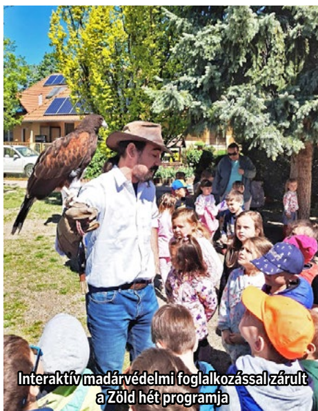
Interaktív madárvédelmi foglalkozással zárult a Zöld hét programja

2026. április 15. és 24. között rendeztük meg óvodánkban a 28. Zöld Hetet „Mit üzen a Föld?” címmel. A programsorozat célja az volt, hogy a gyermekek játékos, élményekben gazdag formában ismerkedjenek meg a környezetvédelem, az egészséges életmód és a természet szeretetének fontosságával.