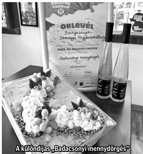
A különdíjas „Badacsonyi mennydörgés”

Nagy büszkeség érte településünket: a Bringatanya – Somogyi Fagylalt Műhely csapata különdíjat nyert a BALATON FAGYIJA