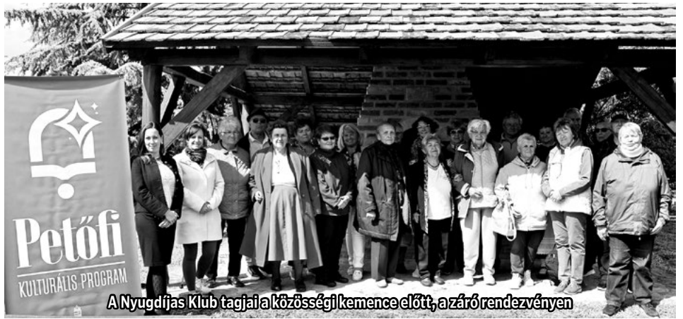
A Nyugdíjas Klub tagjai a közösségi kemence előtt, a záró rendezvényen