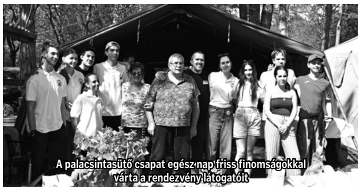
A palacsintasütő csapat egész nap friss finomságokkal várta a rendezvény látogatóit