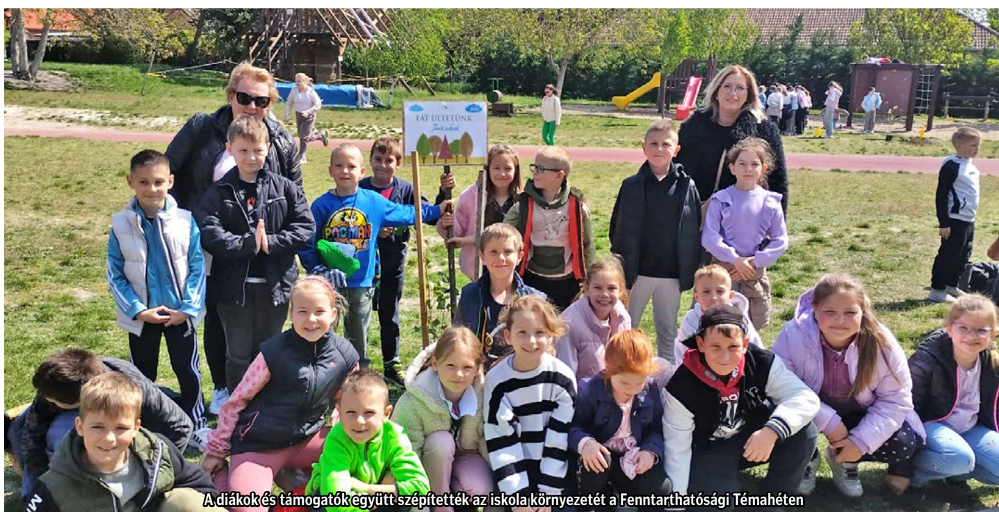
A diákok és támogatók együtt szépítették az iskola környezetét a Fenntarthatósági Témahétén