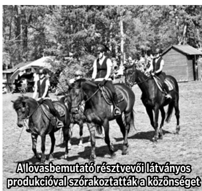
Allovasbemutató résztvevői látványos produkcióval szórakoztatták a közönséget

gyógynövényes bivalypörkölt zalai dödöllével, a SUBIÉK – Subaty étele, a Gyenesdiási Fürdőegyesület – 7 vezér pörköltje, a RETRÓGEREK – Gombócós káposztája. A GYENESDIÁSI GYÜTTMENTEK – Birkapörköltje , a GYENESDIÁSI DALÁRDA – Pincepörköltje , a GYENESDIÁSI NYUGDÍJASKLUB – Nagykorúsított Erdélyi töltött káposztája , a MAGYAR VÁNDOR – Savanyú káposztás bitang leve , valamint a Gyenesdiási Turisztikai Egyesület – Böllerpörköltje . Polgármesteri különdíjat kapott a BEST-OFF csapata – A gyenesi pizzás hortobágyija ételével. Aranyérmes lett a NYUGAT-BALATONI IFJÚSÁGI EGYESÜLET – Lecsós tarhonyája , a GYENESDIÁSI ÍZŐRZŐK – hagyományos gulyás leve és a BUCKÁS KFT – Csülkös káposztája, ázsiai beütéssel - nevű főztje. Gratulálunk mindenkinek!