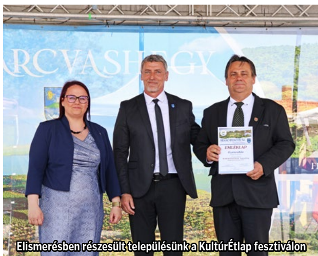
Elismerésben részesült településünk a KultúrÉtlap fesztiválon