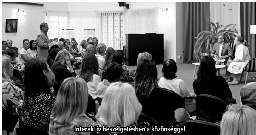
Interaktív beszélgetésben a közönséggel