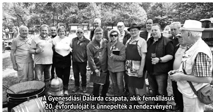
A Gyenesdiási Dalárda csapata, akik fennállásuk 20. évfordulóját is ünnepelték a rendezvényen