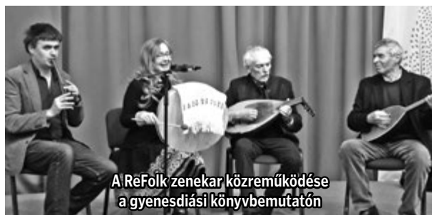
A ReFolk zenekar közreműködése a gyenesdiási könyvbemutatón