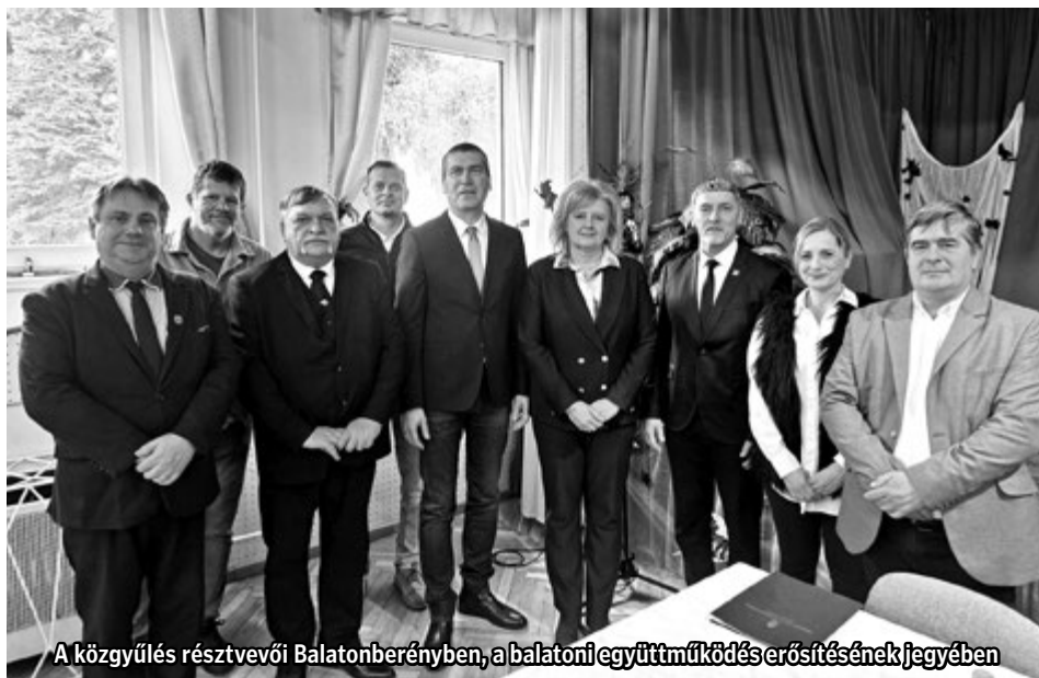
A közgyűlés résztvevői Balatonberényben, a balatoni együttműködés erősítésének jegyében

A Balaton körül, három vármegyében működő 36 polgárőr egyesület munkájának összehangolására tett javaslatot dr. Túrós András Balatonberényben, a Balatoni Vízi Polgárőr Egyesület éves közgyűlésén. Az OPSZ elnöke azt is bejelentette, jogszabálmódosítást kezdeményez annak érdekében, hogy üzemeltetési engedélyt kapjanak a polgárőr hajók a védett vizeken. A január 31-én megtartott rendezvényen a térség polgármesterein és az együttműködő szervezetek képviselőin kívül részt vett Dukai Miklós, a Közigazgatási és Területfejlesztési Minisztérium önkormányzati államtitkára is, aki elismerését fejezte ki a polgárőrök munkájáért.