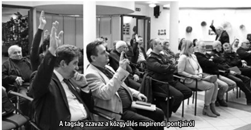
A tagság szavaz a közgyűlés napirendi pontjairól

A rendezvény jó hangulatban zárult, meg erősítve az egyesület közösségformáló szerepét és jövőbeni céljait.