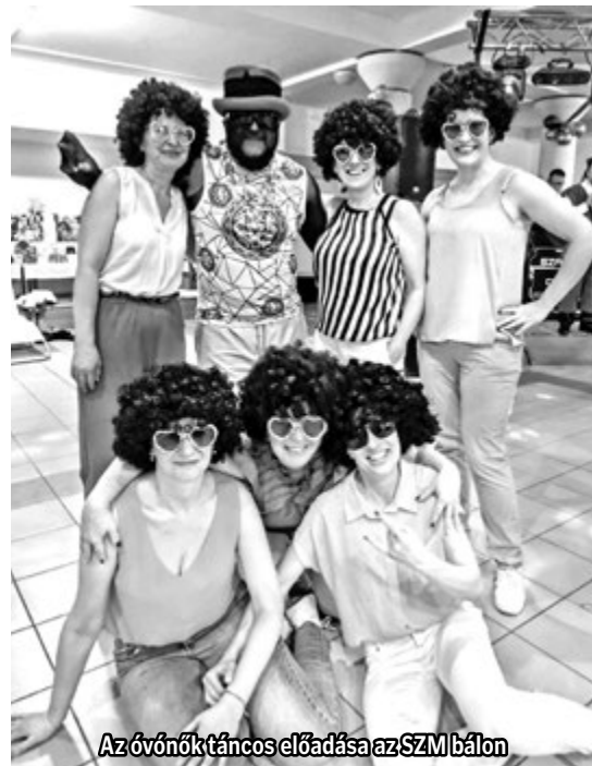
Az óvónők táncos előadása az SZM bálon