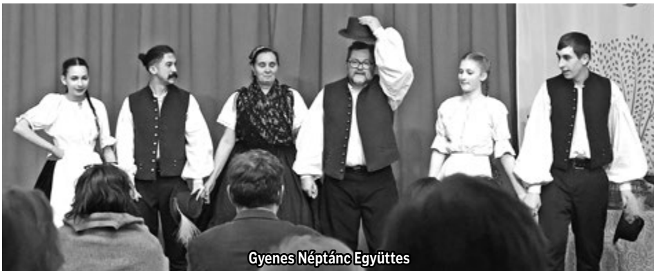
Gyenes Néptánc Együttes

A Magyar Kultúra Napjáról idén is a jeles esemény napján, január 22-én emlékeztünk meg. A Község házán tartott műsoros esten a hagyományoknak megfelelően a Gyenesdiás az elmúlt évben című fényképválogatást kínáltuk megtekintésre, egy szubjektív válogatásban felidézve a 2025-es év számunkra emlékezetes közösségi-kulturális történéseit. Emellett kiállítást rendeztünk a Kosárfonó Szakkör szemet gyönyörködtető alkotásaiból. Az ünnep alkalmából rendezett műsort a Gyenes Néptánc Együttes és a Gyenesdiási Népdalkör produkciói színesítették. Gál Lajos, Gyenesdiás polgármestere beszédében településünk és országunk kulturális gazdagságára és közösségeink fő erejére, az értékekre és a hagyományokra hívta fel a figyelmet.