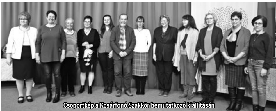
Csoportkép a Kosárfonó Szakkör bemutatkozó kiállításán

80-as évek ikonikus pop-rock legendái címet viselte. A vetített képes prezentációban a hazai pop-rockzene aranykorának nagyjai kerültek terítékre egy szubjektív válogatásban. A következő előadás március 16-án lesz, az előadás címe: Forradalmak zeneművei és zenei újítások.