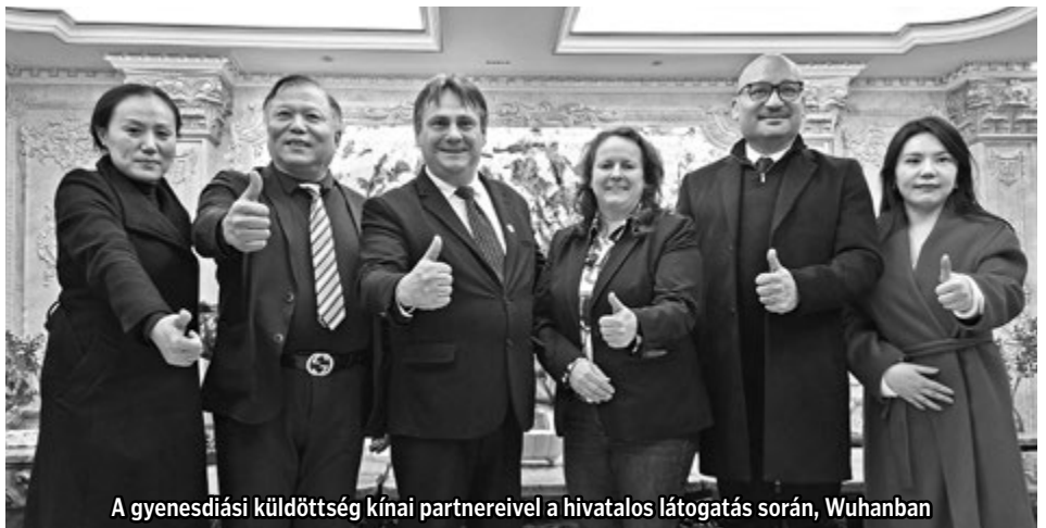
A gyenesdiási küldöttség kínai partnereivel a hivatalos látogatás során, Wuhanban

Az élménybeszámolóra megtelt a nagyterem, és mintegy másfél óra elteltével, sok-sok érdekes információval lettünk gazdagabbak. Megtudtuk, hogy a hivatalos programokon kívül a kirándulások mindig tartogattak meglepetést, akár éttermi forgóasztalokról, akár temetkezési szokásokról volt szó. A mintegy