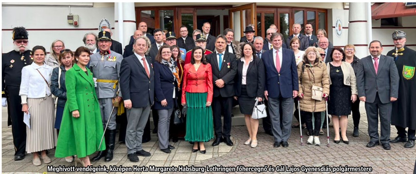
Meghívott vendégeink, középen Herta Margarete Habsburg-Lothringen főhercegnő és Gál Lajos Gyenesdiás polgármestere