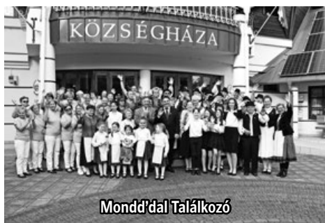
Mondd' dal Találkozó