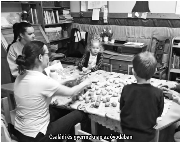
Családi és gyermeknap az óvodában