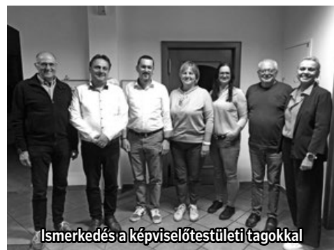
Ismerkedés a képviselőtestületi tagokkal