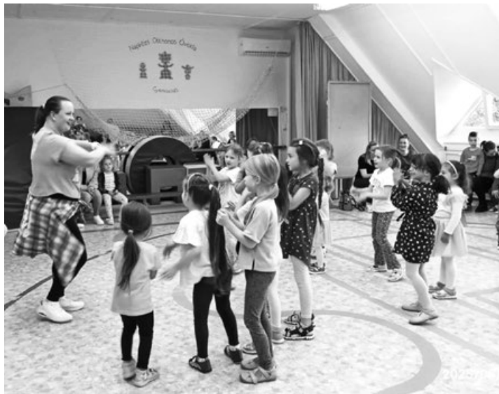
Zumba bemutató az óvodában