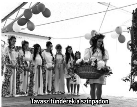
Tavasz tündérek a színpadon