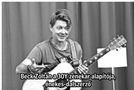
Beck Zoltán @30Y zenekar alapítója, énekes-dalszerző