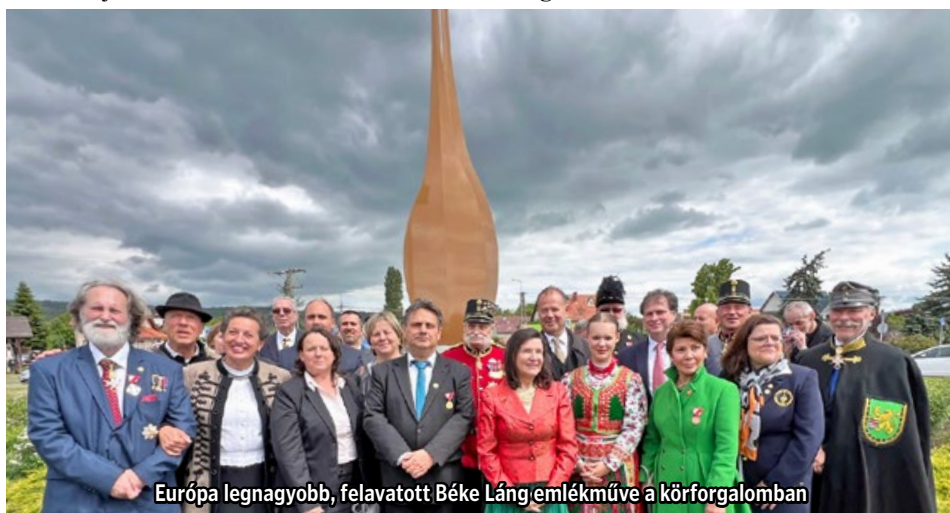
Európa legnagyobb, felavatott Béke Láng emlékműve a körforgalomban

Gyenesdiás immár hivatalosan is a Béke Lángja közösségének része – emlékművei és közössége tanúsítják: a béke, a szeretet és az összefogás nem csak szavak, hanem cselekedetekben élő értékek.