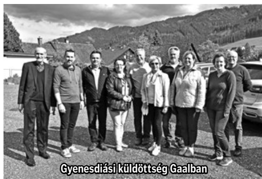
Gyenesdiási küldöttség Gaalban