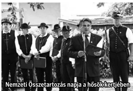
Nemzeti Összetartozás napja a hősökertjében