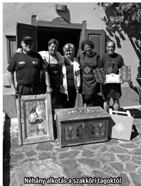
Néhány alkotás a szakköri tagoktól

A munkán kívül igen jókat beszélgettünk és nagy vidámságban töltöttük el az időt, hiszen ez is fontos.