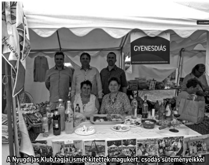
A Nyugdíjas Klub tagjai ismét kitétek magukért, csodás süteményeikkel

Számos diós süteménnyel készültek nyugdíjasaink , amelyek közül többel a sütemény-