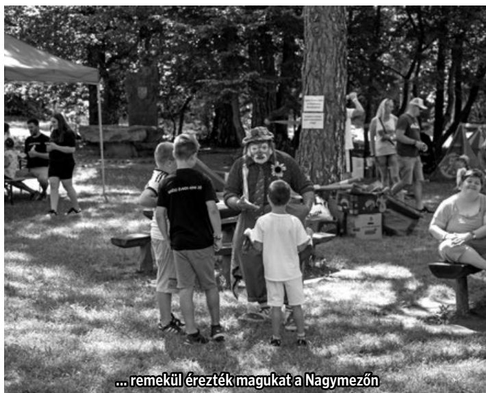
... remekül érezték magukat a Nagymezőn

Laptop és számítógép szerviz ☎ 83/540-640