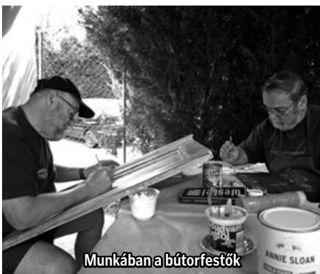
Munkában a bútorfestők

A héten felújításra került többek között egy régi konyhaszekrény, új kötösbe bújt egy