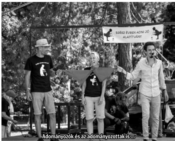
Adományozók és az adományozottak is ...

Az alapítvány jelenleg több mint 100 rászoruló és 20-25 intézményen segít és ehhez járult hozzá a SzeretetNap is, ahol az adományozók a kihelyezett becsületkasszáknál tudtak segíteni. A befolyt összeget a gyermekek nyári étkeztetésére fordítjuk.