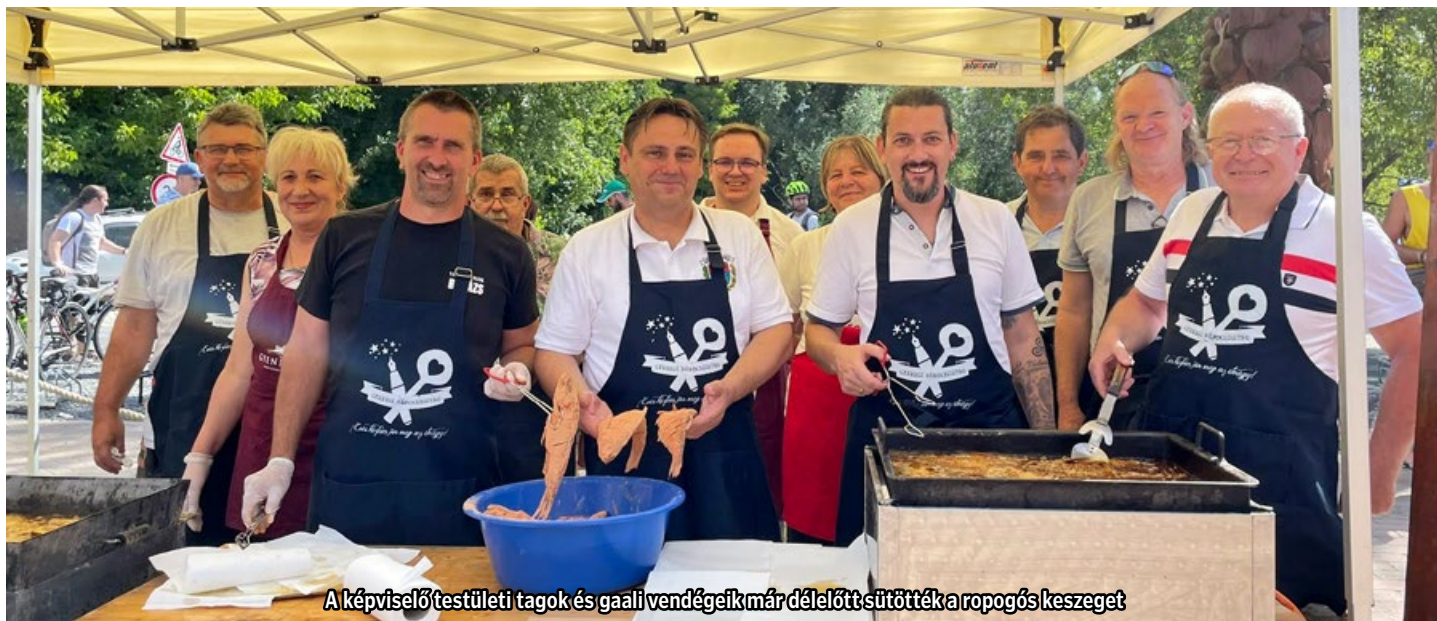
A képviselőtestületi tagok és gáli vendégeik már délelőtt sütötték a ropogós keszeget