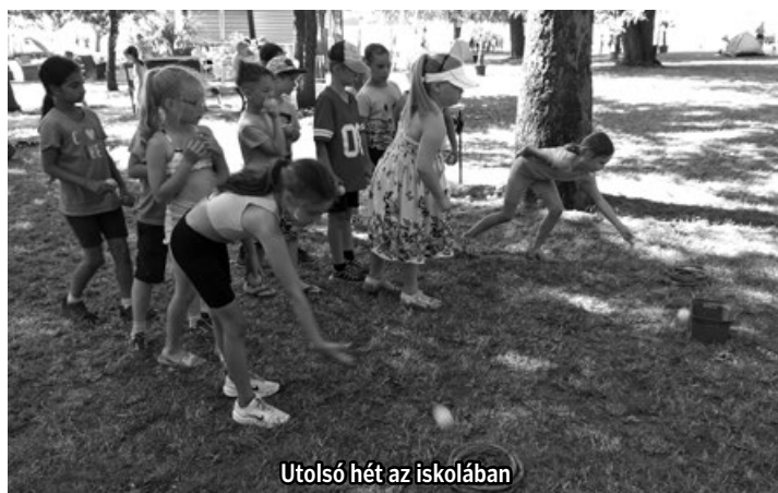
Utolsó hét az iskolában