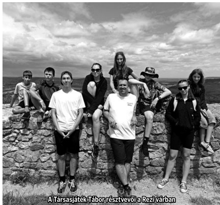
A Társasjáték Tábor résztvevői a Rezi várban

További információ kérhető minden Varázshangok Egyesületi programmal kapcsolatban Kóhalmi Balázstól a 06 30 347 6036 telefonszámon.