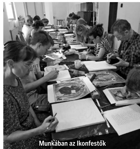
Munkában az Ikonfestők

Az elkészült képeket - szentmisén történő megszentelés után - a művelődési ház klubtermében állították ki, azok július hónapban munkaidőben megtekinthetők (érdeklődni a 83/314-507-es telefonszámon lehet)