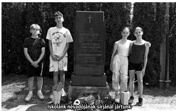
Iskolánk névadójának sírjánál jártunk