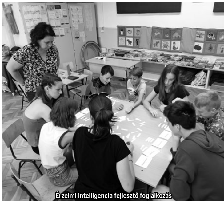
Érzelmi intelligencia fejlesztő foglalkozás