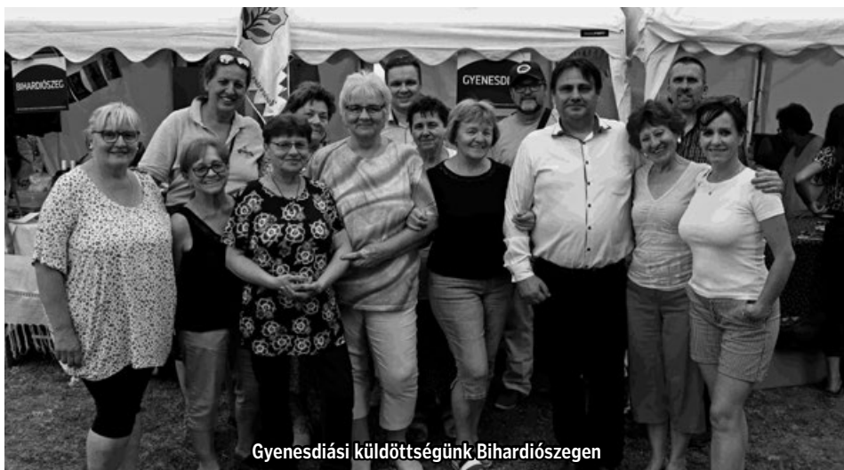
Gyenesdiási küldöttségünk Bihardiószegen