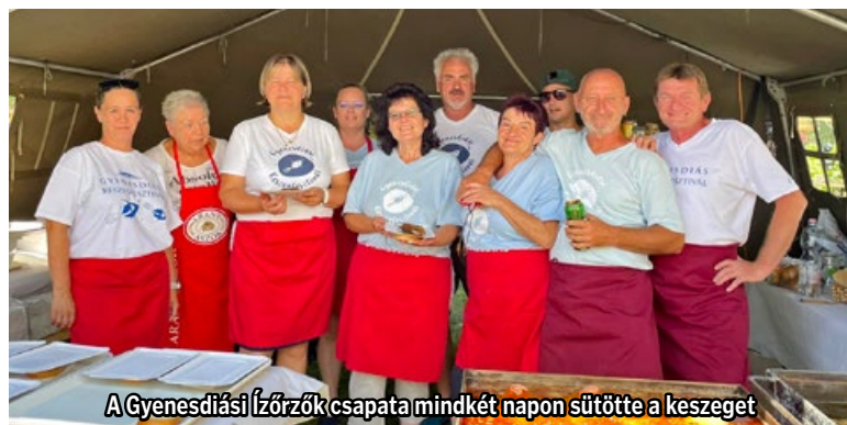
A Gyenesdiási Ízörzök csapata mindkét napon sütötte a keszeget

Reméljük jövőre ismét ilyen szép időben és körülmények között sülni tud majd Gyenesdiáson a keszegek!