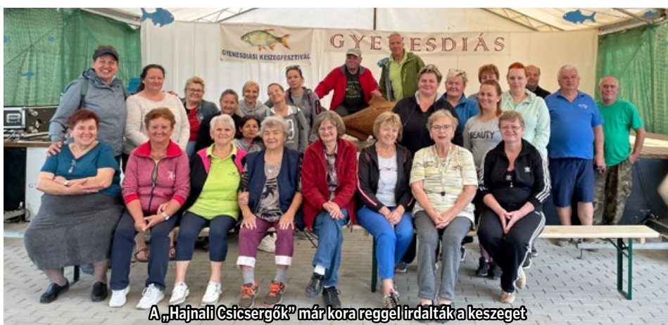
A „Hajnali Csicsergők” már korareggel lirdalták a keszeget