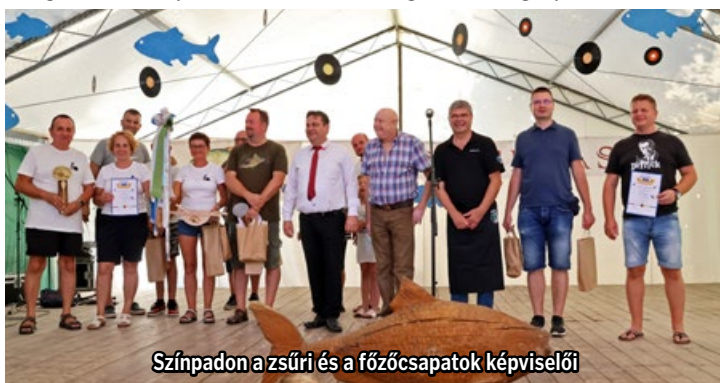
Színpadon a zsűri és a főzőcsapatok képviselői

Július 6-án igazán meleg nyáriás időnek ör-