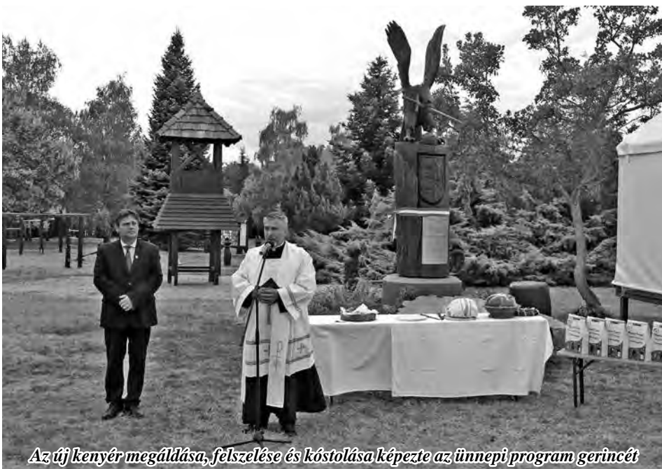
Az új kenyér megáldása, felszélése és kóstolása képezte az ünnepi program gerincét