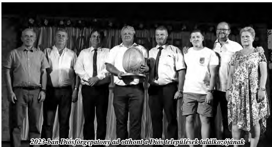
2023-ban Diósförgepatony ad otthont a Diós települések találkozójának

Zárszóul elmondhatjuk, hogy az ideai talál-