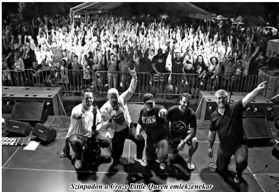
Színpadon a Crazy Little Queen emlékenekar

A háromnapos rendezvény idén a műfaji sokszínűséget tűzte ki zászlajára. Ennek megfelelően a nyitónapon (csütörtök) a varázsos, misztikus múltba kalauzolt minket a Bordó Sárkány zenekar, mikor is középkori rock and roll partit rittyentett a korzó új táncparkettjére. A banda elképesztő hangulatú koncertjét még keretbe foglalta az Anima Prizma Mozgásműhely tízes show-ja. Az estét a Midnight Boogie Band frenetikus bulizenéje kerekítette le. A pénteki napon az egyik legismertebb hazai Queen emlékenekar, a Crazy Little Queen jött Gyenesdiásra. Pontosabban jött, látott, és győzött! Egészen elképesztő tömeg gyűlt össze a tiszteletükre, illetve azért is, hogy egy nagyot táncoljon az örökbecsű Queens-lágerekre. A koncert után a Silver Band muzsikájára ropta a nagyérdemű.