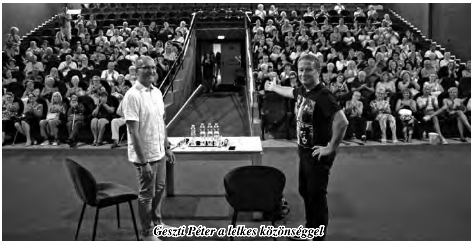
Geszti Péter a lelkes közönséggel

A nyolcvanas évek végi indulásától kezdve szinte az egész pályafutása, szinte minden megnyilvánulása – jó értelemben véve – megosztó. Egyfelől tömegek rajonganak érte, nemzedékek emlékeztetbe vésődtek be poénjai, szójátékai, rímjei, dalai, reklámjai. Másfelől egy hangos kisebbség szinte folyamatosan