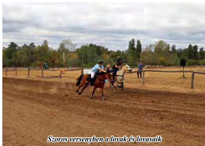
Szoros versenyben a lovak és lovasaik