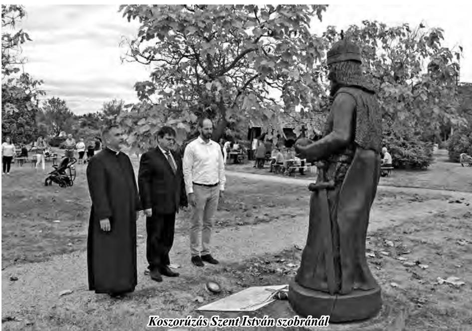
Koszorúzás Szent István szobránál

provokatívabb kérdéseit hallva is. Izgalmas, unikális, felejthetetlen este volt!