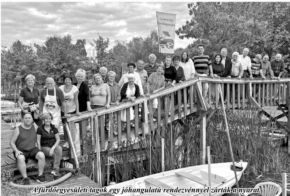
A fürdőegyesületi tagok egy jöhangulatú rendezvénnyel zárták a nyarat.

Másnap, szeptember 3-án részt vettünk a szüreti ünnepségen. A bálványos présnél (körforgalom) a gyülekezést megkönnyítette, hogy az egyesület zászlója alatt találkoztunk. Itt, köszönet a szervezőknek, lehetőséget kaptak az idősebb egyesületi tagok egy lovaskocsival megtenni a piac térig vezető utat. Igyekszünk minden évben valami új, ránk jellemző öltözékbe bújni és így tenni színebbé a felvonulást. Eddig már volt amikor fürdőruhában, míg mások egyesületi trikóban, de volt amikor békatalppal, úszószemüvegben, homokozó játékokkal, pettyes gumilabdával, matrónak öltözve vonultunk.