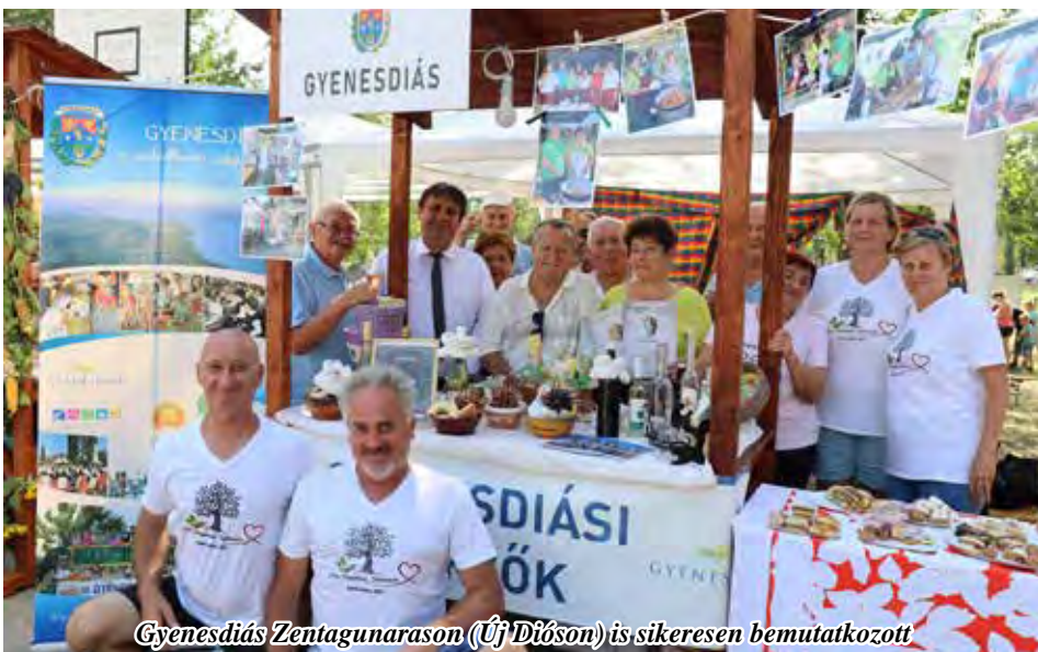
Gyenesdiás Zentagunarasra (Új Diósra) is sikeresen bemutatkozott

Új Diós település a találkozó programját a XXI. Új Kenyér Ünnepe rendezvénye köré szervezte, amelynek kapcsán nem csak a „diósok”, hanem a helyi, környékbeli települések kis csoportjai is műsort adtak. Az időjárási körülményeket tekintve jobbat nem is kívánhattunk volna, a forró nyári melegben jól esett mindenkinek az árnyékban beszélgetni, megismerni egymást.