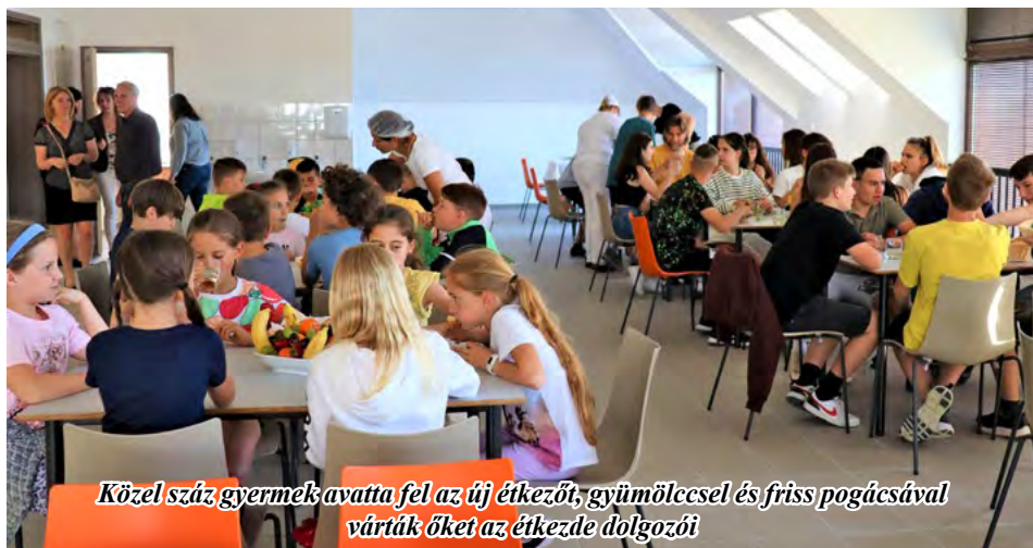
Közel száz gyermek avatta fel az új étkezdét, gyümölcssel és friss pogácsával várják őket az étkezdé dolgozói