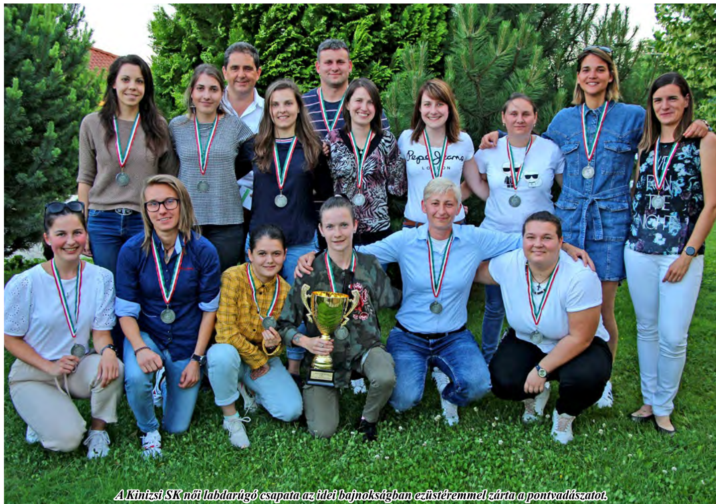
A Kinizsi SK női labdarúgó csapata az idei bajnokságban ezüstérmel zárta a pontvadászatot.