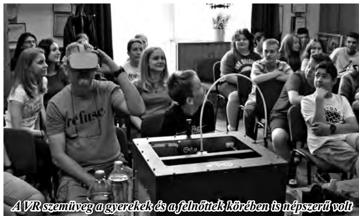
A VR szemüveg a gyerekek és a felnőttek körében is népszerű volt