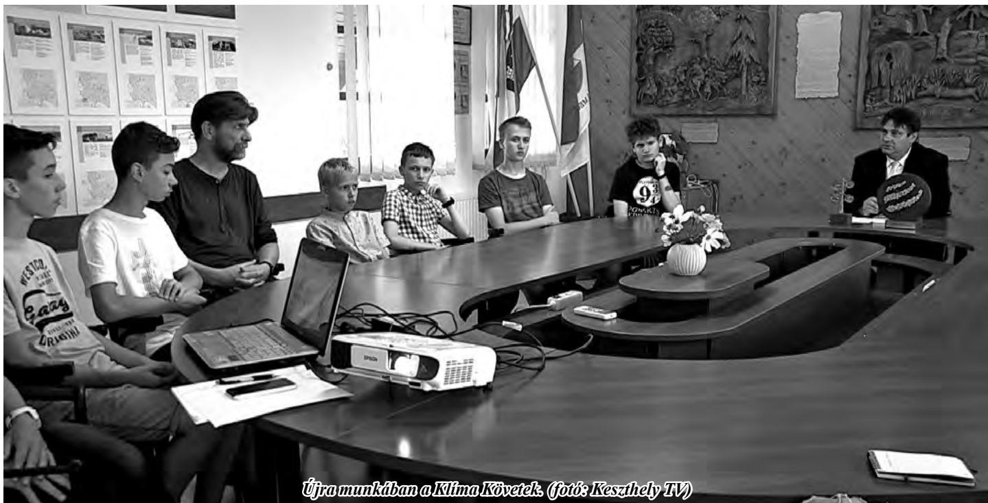
Újra munkában a Klíma Követek. (főforrás: Keszthely TV)