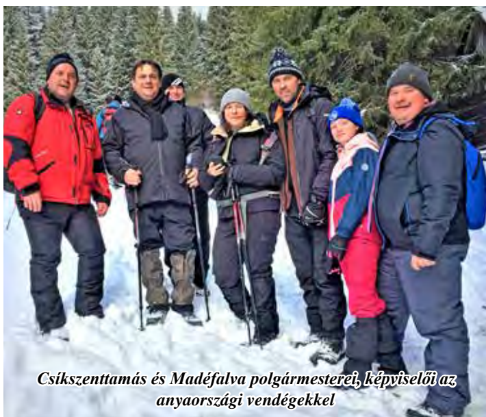
Csikszenttamás és Madéfalva polgármesterei, képviselői az anyaországi vendégekkel

székely határország történetét bemutató, tavaly nyáron megnyílt, közel 600 négyzetméteren berendezett interaktív kiállítást mutatták be, melyet kötetlen beszélgetés követett. Ezen 16 felcsíki és Gyimes-völgyi polgármester jelezte, hogy határon túli magyar közösségekként részt folytatás a 2. oldalon