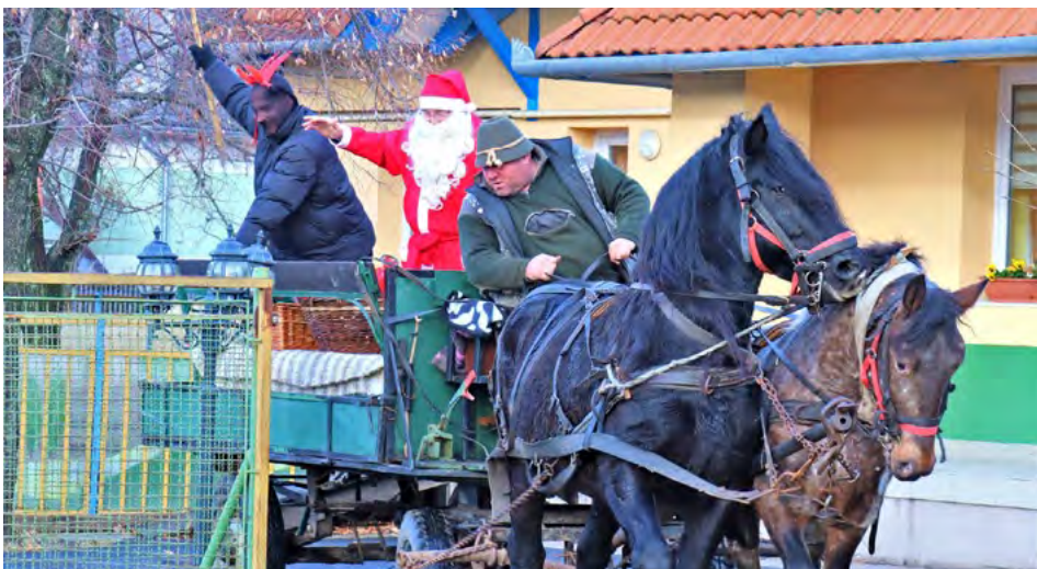
A Mikulás és mindig rosszkaldó Krampusza érkezik az óvodába

Ez az ünnepség is más volt, mint a korona vírus előtti években. A gyerekek csak messziről nézhették a Mikulást, nem érinthették