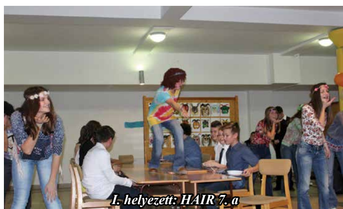
I. helyezett: HAIR 7. a