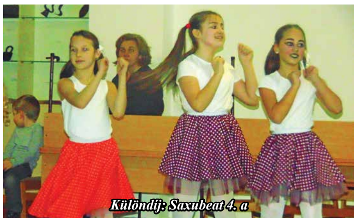
Különdíj: Saxubeat 4. a