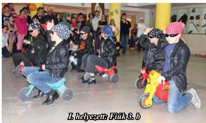
I. helyezett: Fűtők 3. b