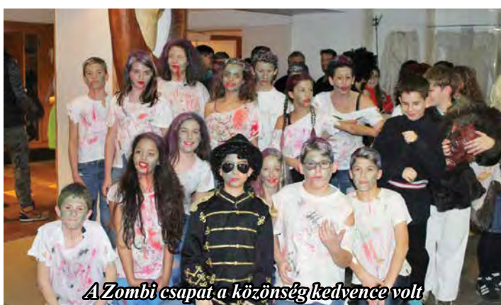
A Zombi csapat a közönség kedvence volt