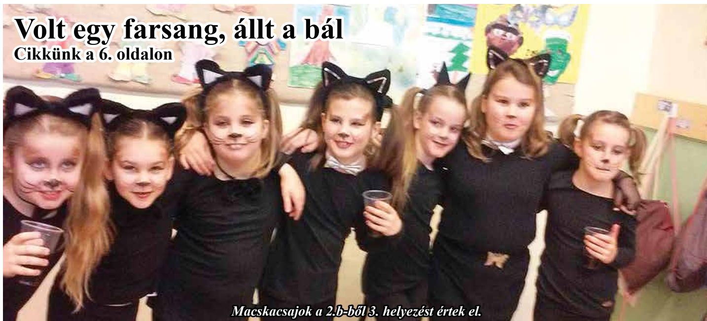
Macskaesajok a 2.b-ből 3. helyezést értek el.