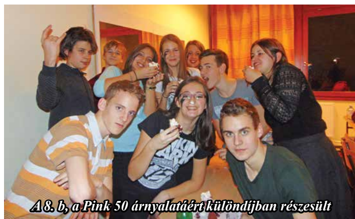
A 8. b, a Pink 50 árnyalatáért különdíjban részesült