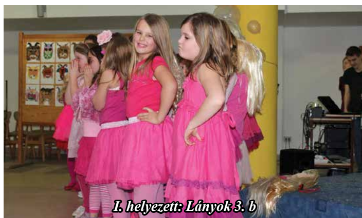
I. helyezett: Lányok 3. b