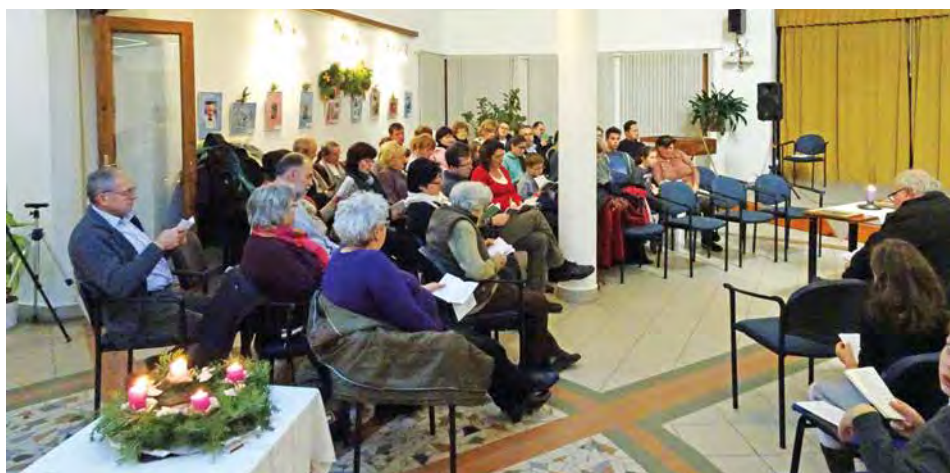
Immár hagyományosnak mondható, a Szállást keres a Szent Család – népi ájtosság - egyik közös rendezvényével együtt tartottuk a Re-Folk zenekar adta karácsonyi koncertet. A két gyenesdiási csoport mellett egy keszthelyi csoport is részt vett ezen az ünnepélyes alkalmon, imádságon.