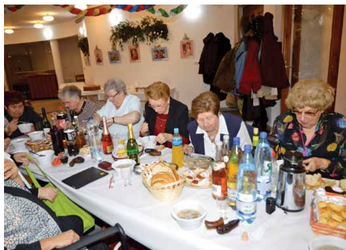
A Nyugdíjasklub pótszilveszterén – január 9-én – jól szórakozhattak az est résztvevői, az „ünnepi menü” hurka-kolbász és az előtte nap készült kocsonya volt.