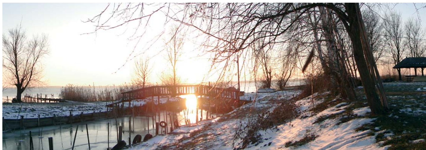
A Diási tanya a lemenő nap fényében.

SOS laptop, számítógép javítás, vírusirtás!