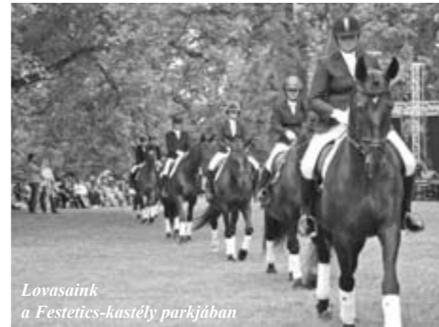
Lovasaink a Festetics-kastély parkjában

Eddig is sok sikert könyvelhetett el magának a település e nemes sport területén, a Kinizsi