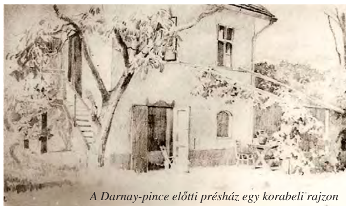
A Darnay-pince előtti présház egy korabeli rajzon

Informationen für Unsere deutschsprachigen Einwohner auf Seite 8.