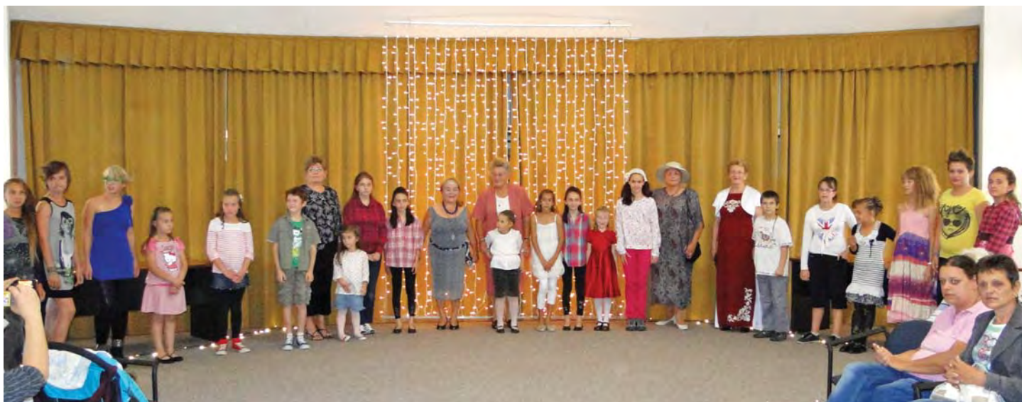
Az Országos Könyvtári Napok programsorozat, ebben az évben az aktív időskorra hívta fel a figyelmet, „Könyvtárak az aktív idősekért” szlogennel. Könyvtárunk egy vidám és színes divatbemutatóval is készült erre az alkalomra. Képünkön a beleváló nagymamák, és unokák. Jobbra lent a könyvtári napok egy másik programja; nyugdíjasaink egy játékos memóriateszten