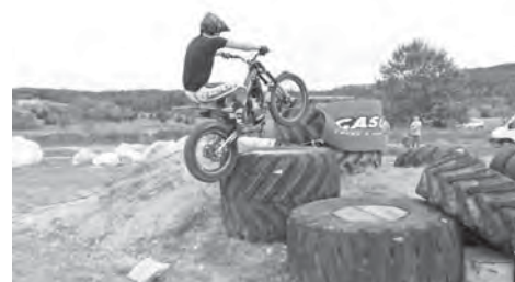
Remek bemutató versenyt rendezett a környékbeli triál motorosokból szerveződött FSTT klub, a Faludi-síkon berendezett pályán, szeptember 30-án.