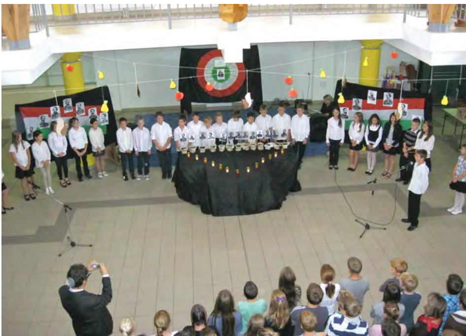
Iskolánkban megemlékeztek a 13 Aradi Vértanúról. Továbbiak a 4. oldalon.