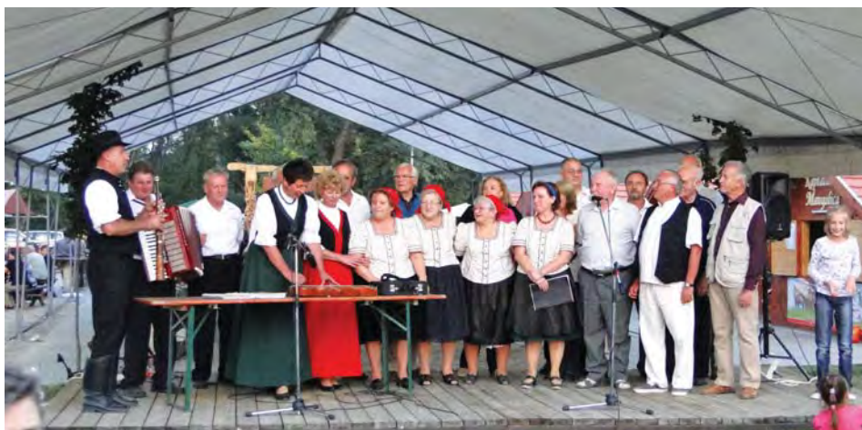
A Nagyrécei Népdalkör, a Gyenesdiási Dalárda és a Citerások spontán műsora