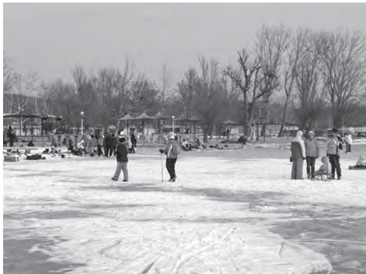
A tél öröme ...