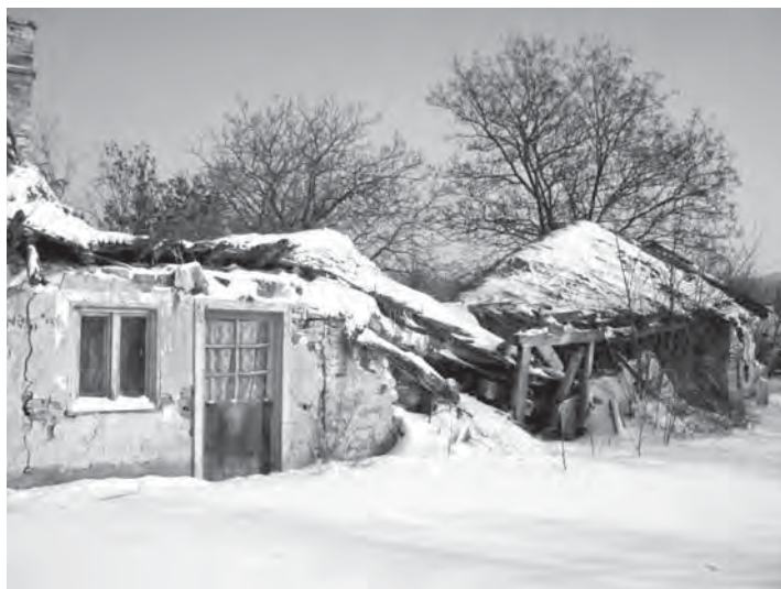
.. és szomorúsága