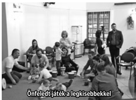
Önfelelt játék a legkisebbekkel

Karácsonyhoz közeledve a hagyományörző Babafotó kiállítás nyitányaként idén már harmadik alkalommal köszöntötte polgármester úr a május és november hónap között született babákat. Az ünnepségen minden gyermek, illetve szülei kaptak egy-egy