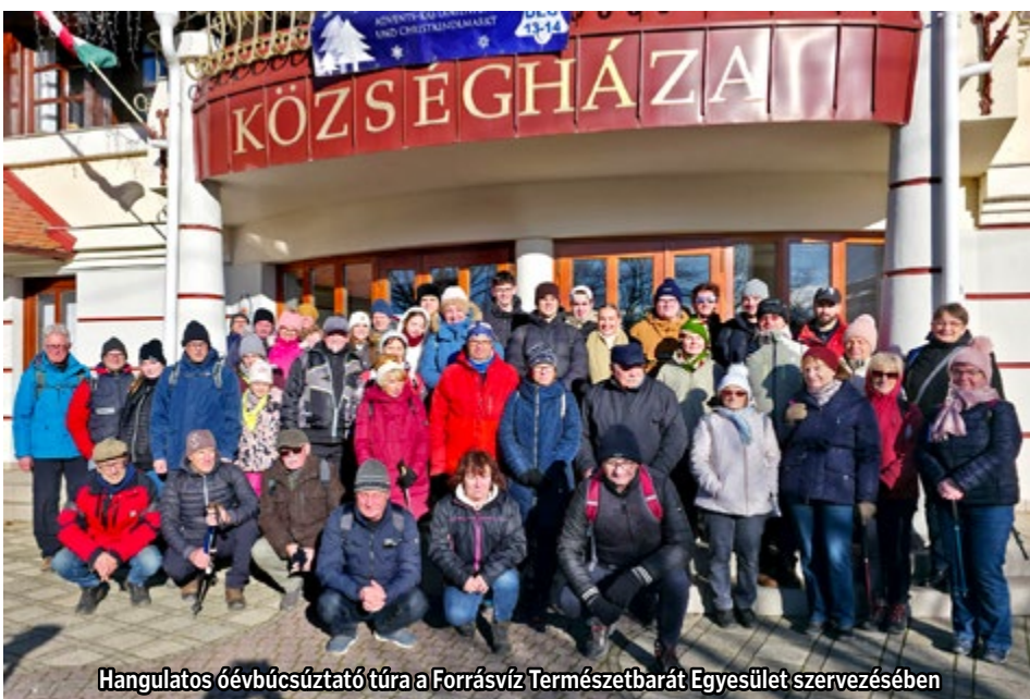
Hangulatos óévbúcsúztató túra a Forrásvíz Természetbarát Egyesület szervezésében