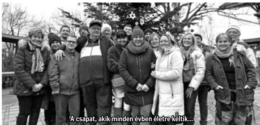
A csapat, akik minden évben életre keltek...