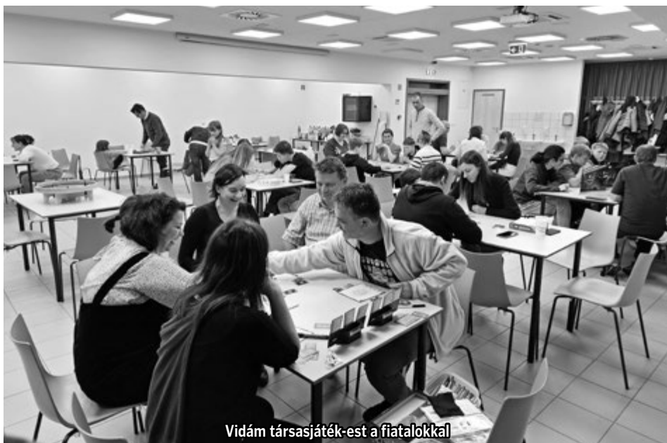
Vidám társasjáték-est a fiatalokkal

Immár harmadik alkalommal rendeztük meg a Társasjátékos Szilvesztert. Este 18.00 órakor kezdtünk, s hamar megtelt az iskolások által használt ebédlő. A rendezvény célja,