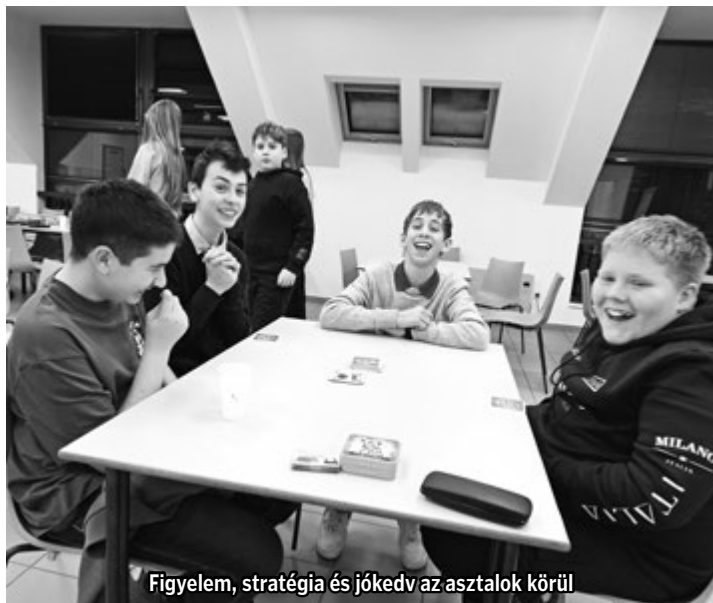
Figyelem, stratégia és jókedv az asztalok körül