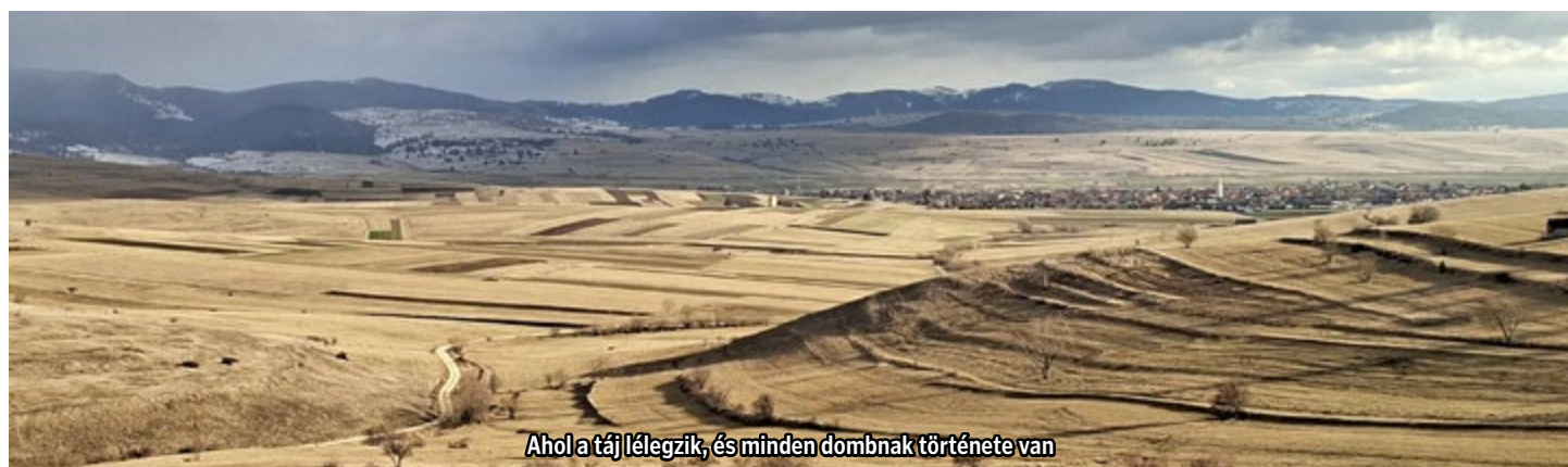
Ahol a táj lélegzik, és minden dombnak története van