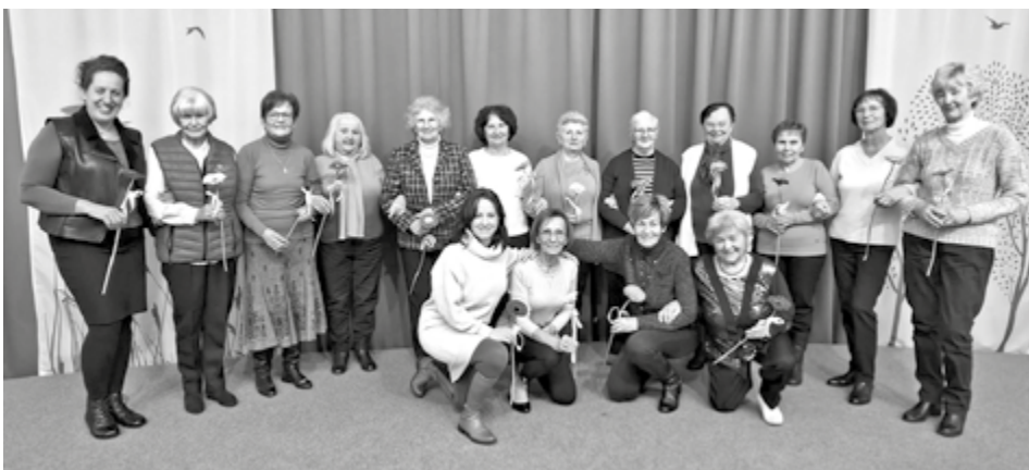
2026.01.06-án a Gyenesdiási Dalárda Vízkereszt-napi Évadnyitóján készült felvétel, melyen a dalárdánk nagy családjának hölgytagjai láthatóak, akiknek a támogatása nélkül nem lennének ilyen sikeresek.