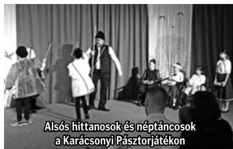
Alsó hittanosok és néptáncosok a Karácsonyi Pásztorjátékon