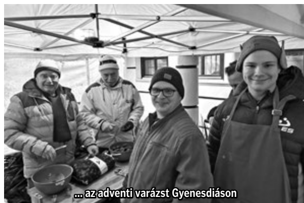
...az adventi varázst Gyenesdiáson