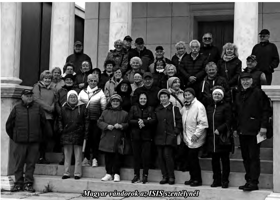
Magyar vándorok az ISIS szentélynél

Így tettük legutóbb is, mikor Sárvár és Szombathely látnivalóiból merítettünk. Hiszen minden egy napba nem is férne bele. Még az utolsó napon is át kellett szerveznem a programunkat, mert az időjós kellemetlen hívős időt jelzett erre a napra. Igaza lett. Bár rossz idő nincs, csak rosszul öltözött turista – tartja a mondás. Esős arcát mutatta az idő, amikor Sárvárra érkeztünk. Ott a vár igazgatója vezetett bennünket. Ami ismeretek elhangzottak az autóbuszban, elhangzottak a helyszínen is, megerősítve a tőlem hallottakat. És mire a Nádasy-várból kijöttünk, már nyoma sem volt az esőnek, így a belvárosi sétánkat még a harangjáték dallama is jókedvűen kísérte.