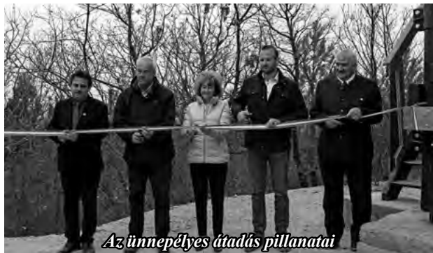
Az ünnepélyes átadás pillanatai

- a klub elnöke, a kirándulások szervezője -