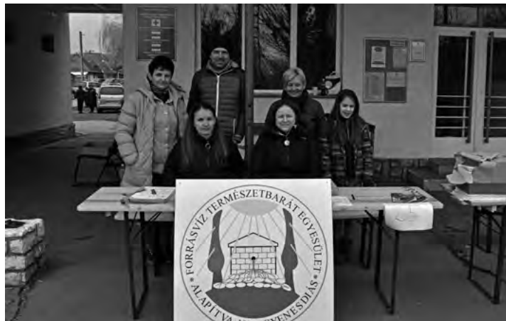
Az egyesületi tagok és segítők 13 ponton fogadták a túrázókat.