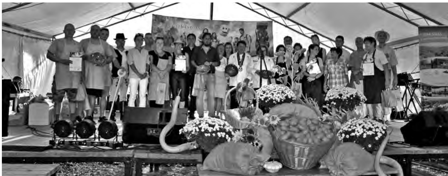
folytatás a 2. oldalról

Munkájuk elsődleges célja, hogy a kertkultúrát mindenki számára elérhetővé tegyék, akár szaktudással akár palánták adományozásával támogassák az érdeklődőket. Végül, de nem utolsó sorban Kedves Róbert, Csíkszenttamás polgármestere köszönte meg a szíves vendéglátást. Kiemelte, hogy bár közel 1000 km választ el bennünket, szellemiségben, hazaszeretben egyek vagyunk. Köszönetük jeléül egy, a Feneketlen-tavat ábrázoló festményt nyújtottak át.