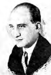
Rejtő Jenő (1905-1943)