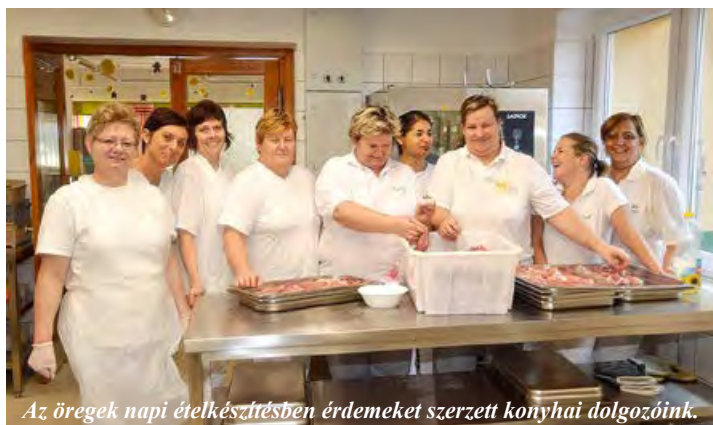
Az öregek napi ételkészítésben érdemeket szerzett konyhai dolgozóink.