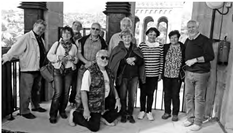
Legbátrabbak a Székesegyház tornyában

Nehéz elhinni, de tavasszal leszünk öt évesek! Öt év alatt több, mint negyven úton, rengeteg látnivalót kerestünk fel. Az előtűnk álló tél jó alkalom lesz arra, hogy statisztikát készítsünk, milyen sok Gyenesdiási lakosnak szereztünk maradandó élményeket kirándulásaink során.