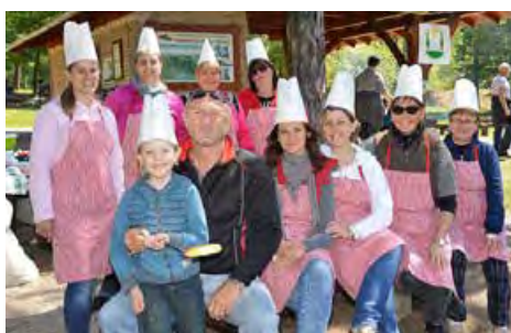
A Gyenesdiási Óvoda és Bölcsőde csapata