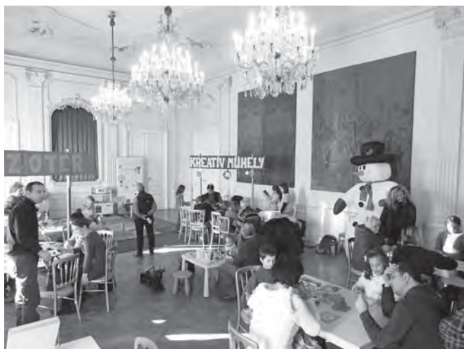
Hercegi Játsszószoba a Kastélyban

Ismét örömteli eseménnyel zártuk az elmúlt évet és kezdtük az újesztendőt! Varázshangok Családi Játsszóházunk a keszthelyi Festetics-kastély északi szárnyának gyönyörű báltermében várta az érdeklődőket.