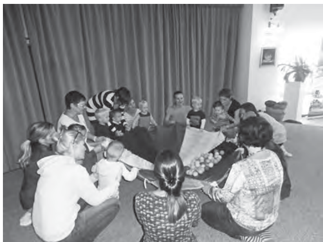
Baba-mama klub és zenebölcsi

A visszajelzések alapján minden látogató örömmel üdvözölte a kastély kezdeményezését, mely a környéken egyedülálló szabadidős programot nyújtott a két ünnep között öt napon keresztül négy órában. Sokat dolgoztunk azon, hogy minden visszatérő, vagy akár egyszeri, vidékről érkező vendég elégedetten, jó érzésekkel távozzon a játsszóházból és szép élményekkel térjen haza, messzire víve a Festetics Kastély és a Varázshangok Játsszóház jó hírét! :) Minden nap más tematikájú játsszóházzal készültünk. A 20 nm-es tatamival fedett babajátsszóterén a bölcsődés és az óvodás korosztály forgókkal, ügyességi hintákkal, Montessori játékokkal, vonatpályával és óriás terepasztallal, autókkal, építőköccakkal, golyópályákkal, és még számtalan egyéb életkori sajátosságoknak megfelelő játékkal játszhatott.