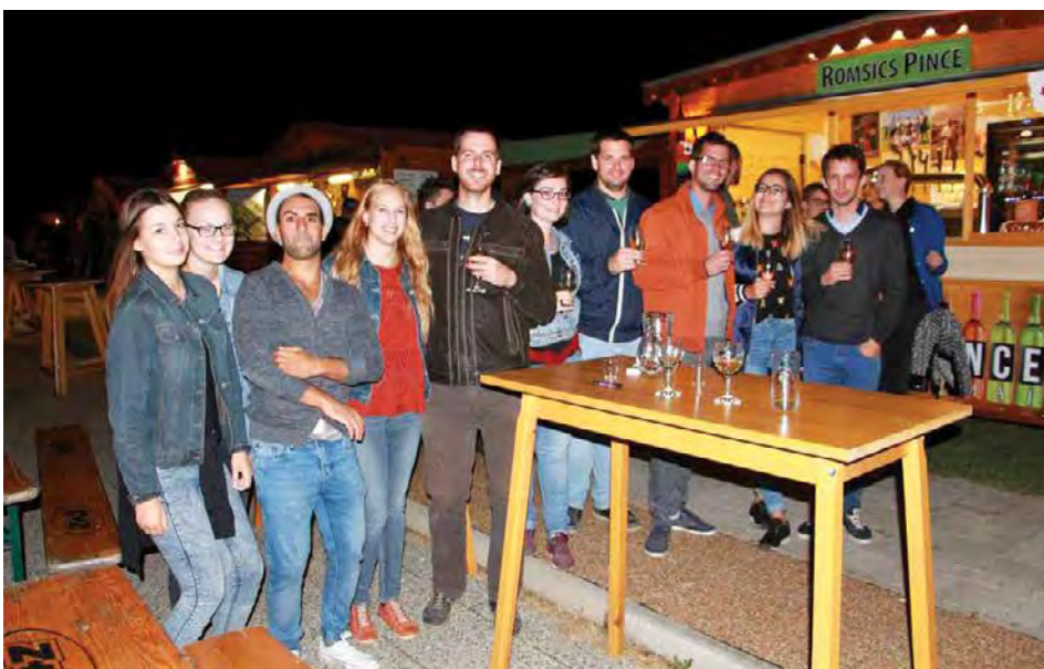
Borfesztiváli hangulat a Romsics pince előtt

Legnagyobb rendezvényünk, a Gyenesdiási Bornapok hétvége időjárása nem sok jóval kecsgetett. A megelőző nap szerdán hatalmas vihar vetett véget az addig igazi nyári időnek, szerencsére csütörtökön, a nyitónapon nem esett, a hűvös idő ellenére viszonylag sokan jöttek el. Pénteken még kitarított az idő – szerencsére –, így zavartalanul zajlottak a tervezett műsorok, amelyek közül a Nagy Feró és a Beatrice koncertje az elmúlt 17 borfesztiválunk talán leglátogatottabb programja volt. A szombati napra aztán beköszöntött az eső, egész nap esett délután 6 óráig, akkora elállt, de a levegő nagyon lehült, alig volt érdeklődés. Vasárnapra szerencsére szép idő lett, a nap is kisütött, sokan élvezték a műsorokat. Idén először tűzijátékot is tartottunk, több mint 10 percig szebbnél-szebb látványelemek díszítették az eget.