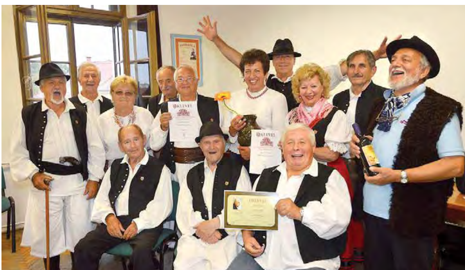
Dalárdásaink elvarázsolták az egri közönséget és kiváló minősítést kaptak. Cikkünk a 4-5. oldalon.

A kiállítás még június 28-ig megtekinthető.