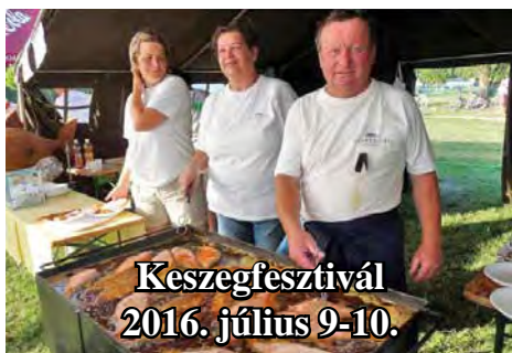
Keszegfesztivál 2016. július 9-10.

Programjainkra szeretettel várunk minden érdeklődőt.