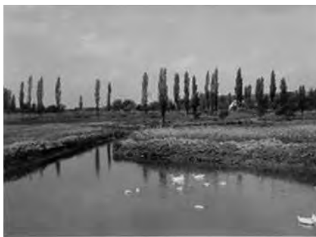
János-forráscsoport főforrása (1932)

Válluson a Csettegő-forrás. A források foglalásaikkal együtt helytörténeti és kultúrtörténeti értékeket is magukban hordoznak. Fontos megjegyezni, hogy minden vizes élőhely ex lege , vagyis önmagában védett.