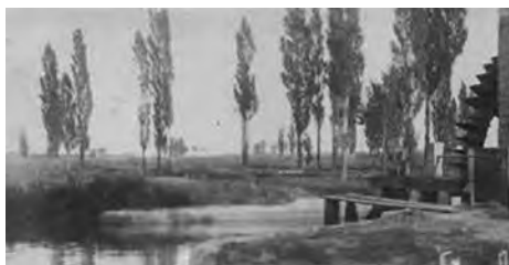
Az egykori Bujtor-Oswald-féle vízimalom 1906-ból a János-forrás alatt