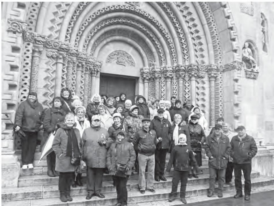
Jákai templomkapu és a Magyar Vándorok a Vajdahunyad várában

az asztalra? Erről április 8-i rendkívüli klubnapunkon döntünk, felállítva az operatív bizottságot. (18.00 Klubkönyvtár)