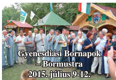
Gyenesdiási Bornapok - Bormustra 2015. július 9-12.