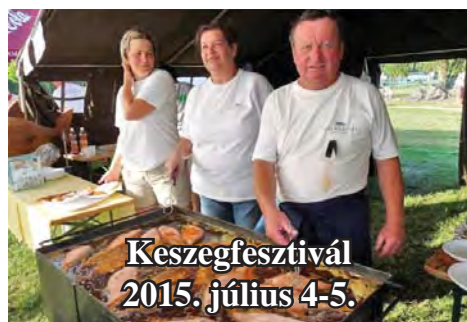
Keszegfesztivál 2015. július 4-5.

július 29-én, szerdán 20 órakor Községházi Esték első hangversenye a Községháza nagytermében. Fellép a Varázshangok kórus és gitáros együttes