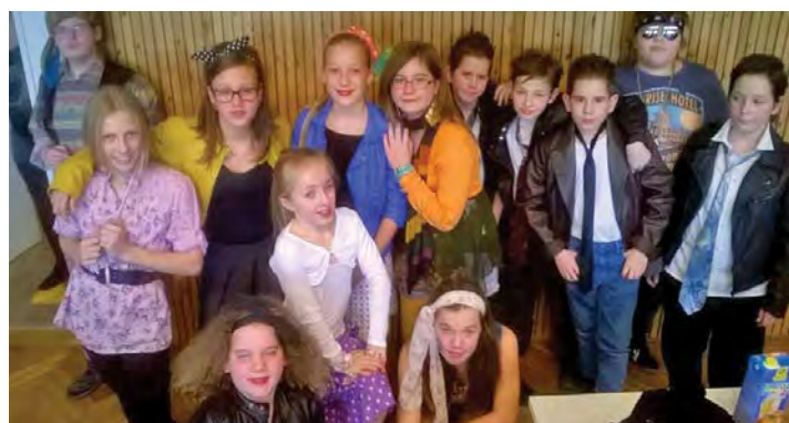
Menők vagyunk: 5.b