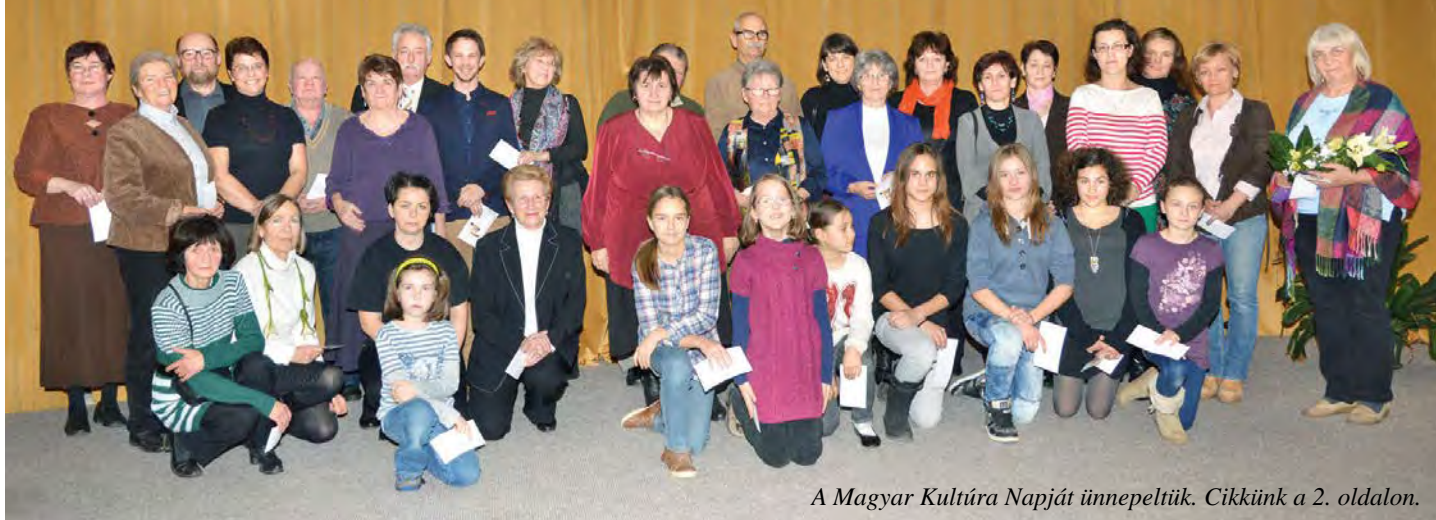
A Magyar Kultúra Napját ünnepeltük. Cikkünk a 2. oldalán.