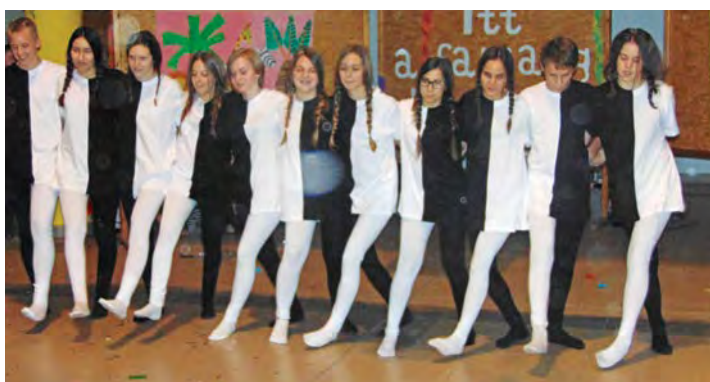
2. helyezett: felemás 8. b