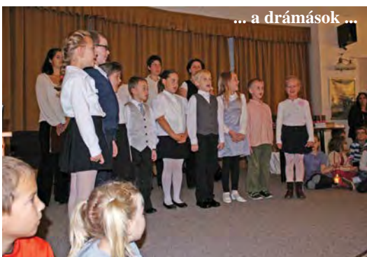
... a drámások ...