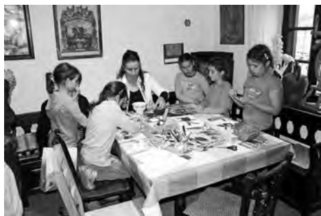
Az akció keretében tartott kézműves foglalkozás a pásztorházban

A Balaton Turizmus Szövetséggel karöltve lebonyolított Nyitott Balaton őszi akcióját sikeresen zártuk. A balatoni összefogás, közös munka eredményeként ezúttal is számtalan riport (TV és rádió), illetve cikk (nyomtatott és online is) jelent meg komoly PR értékkel, ráirányítva a figyelmet, hogy a Balatonhoz nemcsak nyáron érdemes ellátogatni.