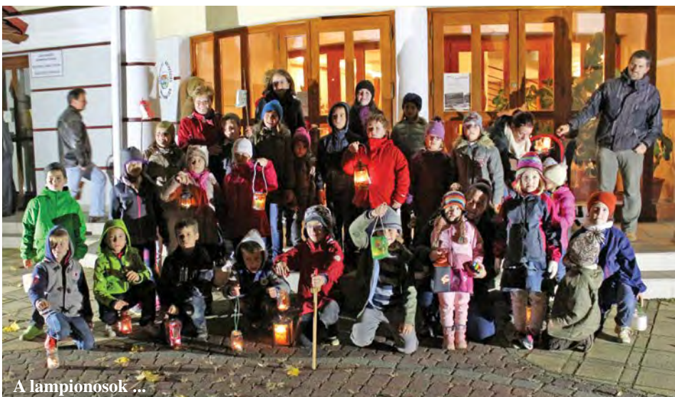
A lampionosok ...

A pecsenyét készítő családok és háziasszonyok jóvoltából finomabbnál-