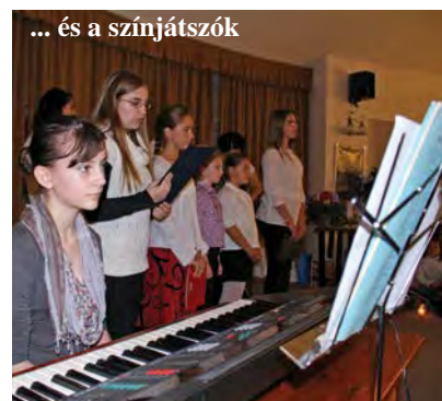
... és a színjátszók