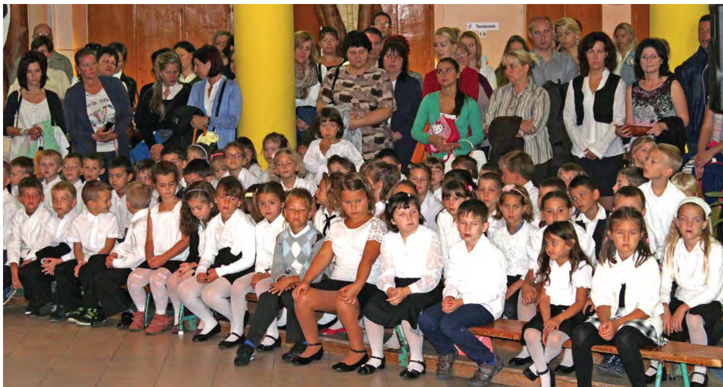
Többek között két elsős osztály, 28-28 tanuló kezdte meg az iskolát szeptember 1-jén. Képünk az évnyitón készült.