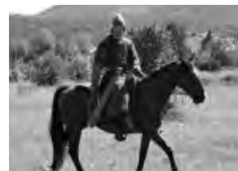
Pillanatképek a Vazul lovas hagyományörzők és a Magyar Történelmi Íjász Társulat gyenesdiási szakmai táborából (9. oldal)

Riasztók és kamerák szerelése, akár átjelzéssel is! ☎ 317-100