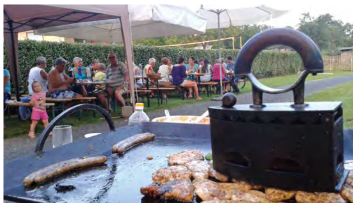
A Malom utcai fesztivál (lásd 4. oldal) nem egy országos rendezvény, mégis említést érdemel, egy lakóközösség összefogása nyilván nem csak egy ünneplésben merül ki.