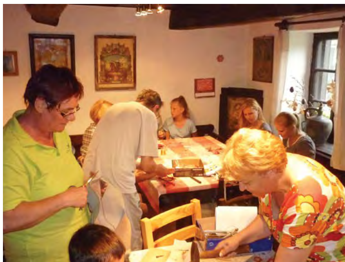
Nagyon látogatottak a Pásztorházban tartott kézműves foglalkozások. A település kínálatában szereplő állandó programok között a gyakori rossz idő miatt (is) sokan próbálkoznak a keddi bőrzés, ékszerkészítés, a szerdai hímzés és a csütörtöki mézeskalács díszítés technikákkal.