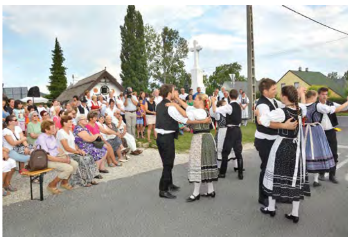
Július 25-én zajlott a J & A Kerámiaház hagyományos Kristóf-napi háziünnep (továbbiak az 5. oldalon)