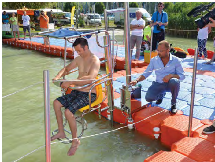
Július 24-én került átadásra a Diási játékstrand többfunkciós mobil stégje, illetve az itt létesített akadálymentesített vízi bejáró. A most felavatott elemek tovább színesítik a „Balaton legjobb strandja” kínálatát, illetve megkönnyíti a mozgássérültek vízbe jutását.