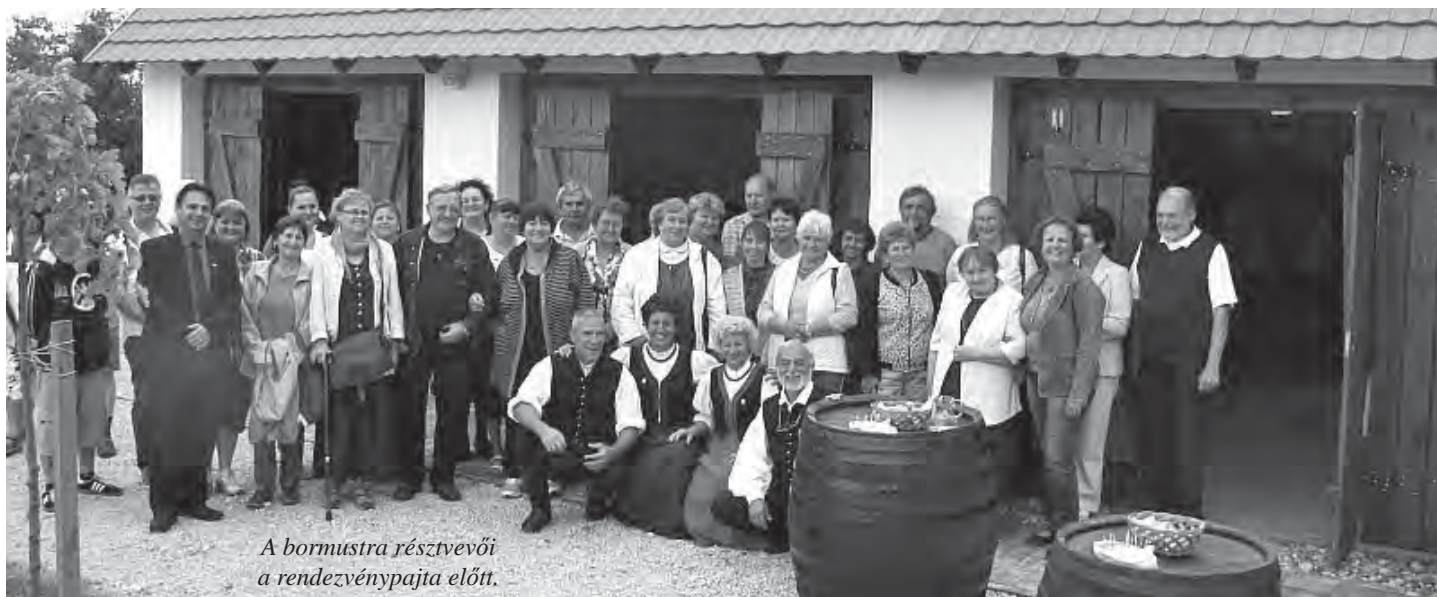
A bormustra résztvevői a rendezvényt pajta előtt.