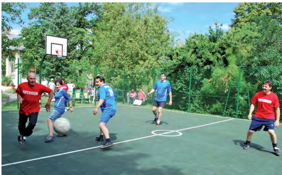
A Kapernaum 80 éves jubileumán több sportverseny, köztük kispályás foci is volt, képeinken a vendéglátók Gyenesdiás Önkormányzat csapatával játszanak. Alsó képeink az ünnepi istentiszteleten készült. (tudósításunk a 3. oldalon)

Ne tegye és más se! Mi tisztán szeretjük Gyenesdiást!