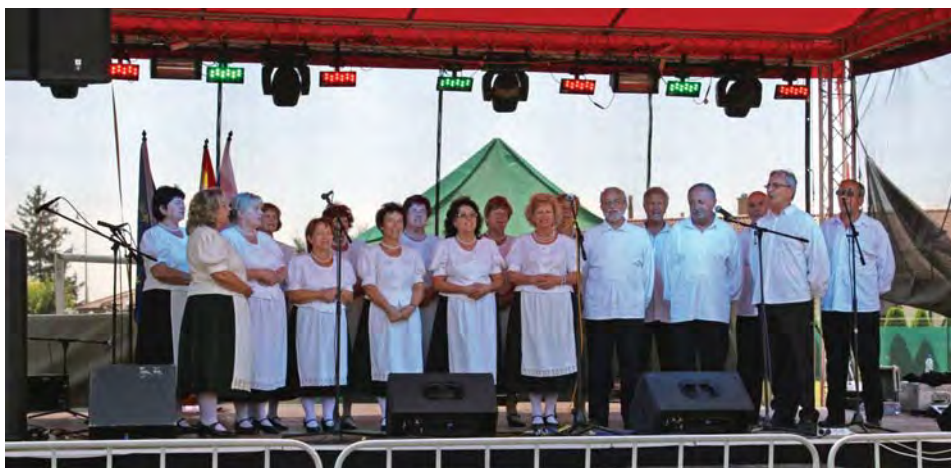
Színpadon a Népdalkör (fent) és a Dalárda (lent)