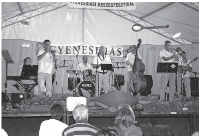
A Molnár Dixieland Band Magyarország egyik legnevesebb dixie zenekara

Már szombaton is sült a keszeg rendszeren, önkéntesek közreműködésével is. Köszönet