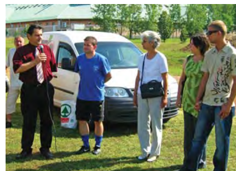
(Cikkünk a 9. oldalon)