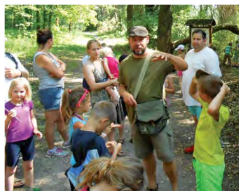
Iskolásaink a tanítási év utolsó hetében játékos vetélkedőkön, sportnapon a strandon és az erdőben (lásd 7. oldal)