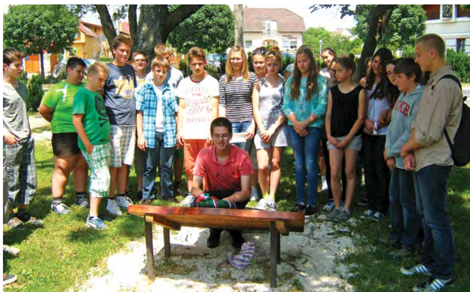
Koszorúzás a Trianoni emléktáblánál (lásd 7. oldal)