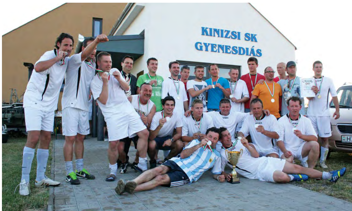
A Kinizsi SK megyei II. osztályú ezüstérmes csapata (lásd 8. oldal)