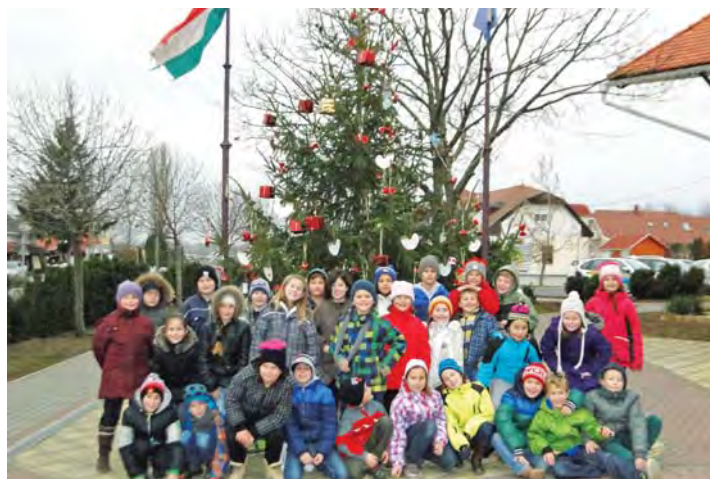
A Községháza előtti karácsonyfát idén is az első osztályosok díszítették fel.