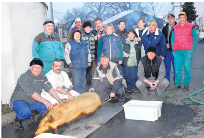
András-napi disznóvágók. A „disznóságok” az öregek asztalára kerültek