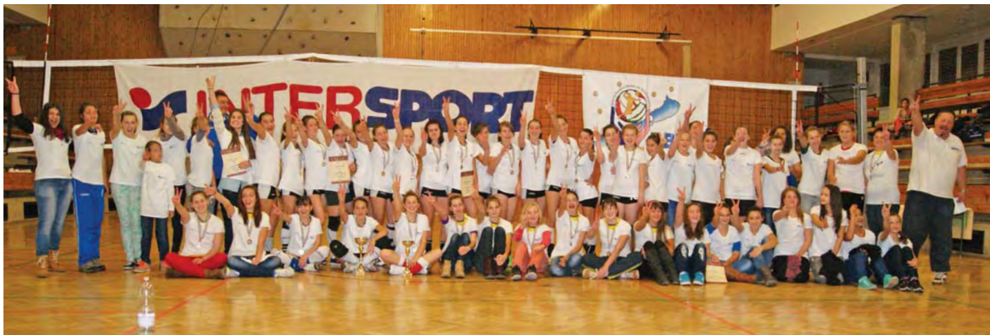
A Nyugat – Balatoni Regionális Sportcentrum Egyesület (Gyenesdiás) által szervezett röplabdatorna résztvevői (lásd: 10 oldal)