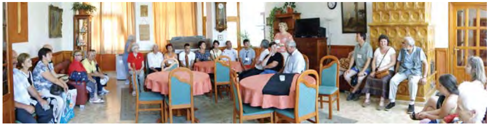
A küldöttségek az Evangélikus Szeretetotthonban (fent) és a bölcsődében (lent)

A szombati nap délutánján került sor a települések bemutatkozására, mi