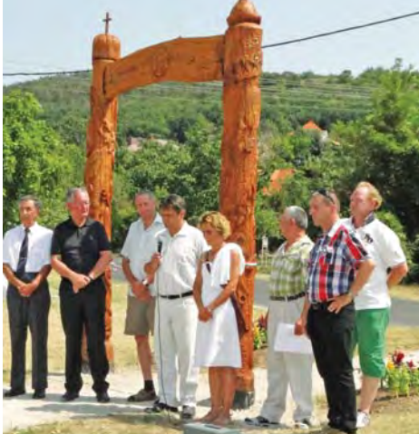
Az emlékpark új kapuja avatása

Megtekintették az Evangélikus Szeretetotthont , illetve tájékoztatót hallhattak az ott folyó tevékenységről, különösen az idősek ápolásáról. Ellátogattak az iskola, az óvoda és a bölcsőde épületébe. Valamennyi intézmény kapcsolódik az aktuális EU-s központi témákhoz – a fiatal és időskor -, valamint mindegyik épületegyüttes jelentős EU-s támogatásból bővült fejlődött, nem beszélve arról, hogy a bölcsőde szinte teljes egészében ilyen támogatásból épült meg. Osztrák vendégeink el is csodálkoztak, mennyi forrást sikerült Gyenesdiásra lehívni, pályázatban elnyerni.