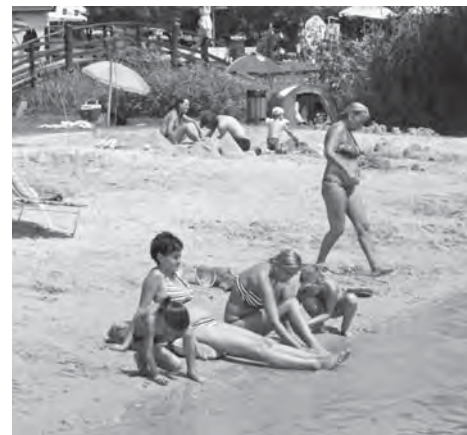
Az alsógyenesi lidóstrandon

Kursbeginn: am 12. September. Anmeldung: 06-30/607-36-94