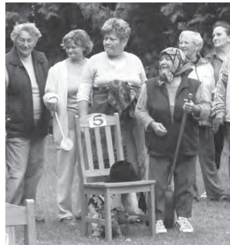
A gyenesdiási nyugdíjas csapat a sorversenyre koncentrált

Örömmel számolhatunk be, hogy a gyenesdiási nyugdíjasklub a főzőversenyt megnyerte , ezzel elérte, hogy a rendezvényt támogató Kis Rába-menti Takarékszövetkezet folyószámlát nyitott részére.