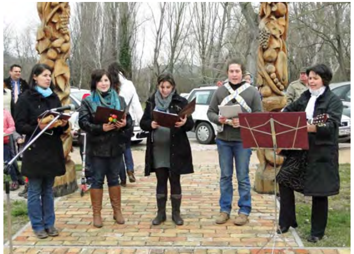
A piaci szezonnyitón élvezhettük – többek közt – a Varázshangok Családi Kórus műsorát. Lásd a 7. oldal: Piaci hírek