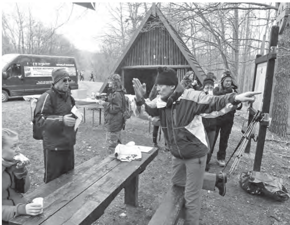
Útbaigazítás a Lepke teljesítménytúrára a Büdöskúti pihenőnél.

2012 évben megvalósult a Balaton-felvidéki Nemzeti Parkkal közösen beadott „Keszthelyi-hegység védett természeti területein illegális személtelakóinak felszámolása” – című pályázat. Ezen belül 2012