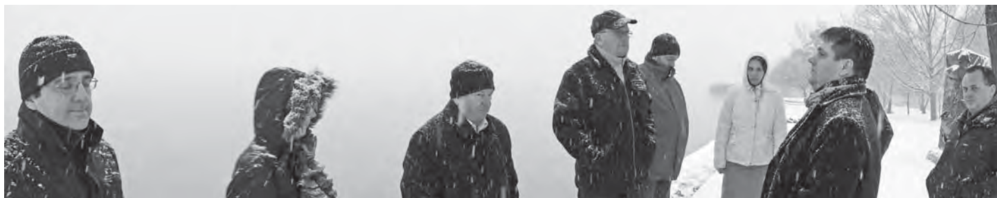
Felkészülés a nyári idegenforgalmi szezonra – bizottsági bejárás a Diási strandon március 25-én.

A KÉPVISELŐ-TESTÜLETI ÜLÉSEK TOVÁBBRA IS NYILVÁNOSAK!