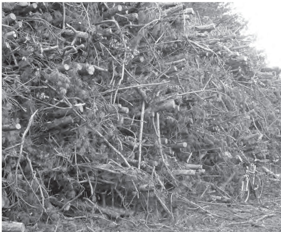
A 2012. évi csapadékhány miatt a fekete fenyő állomány jelentős része száradt el a Keszthelyi-hegységben. Az elpusztult fákat az erdészet kitermeli.