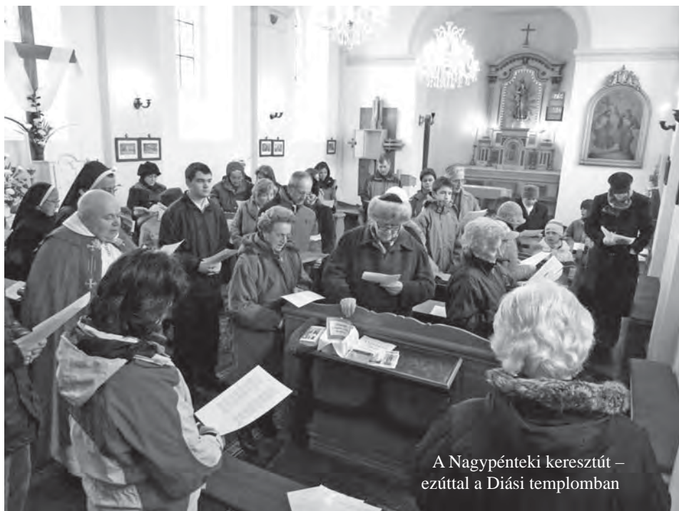
A Nagypénteki keresztút – ezúttal a Diási templomban