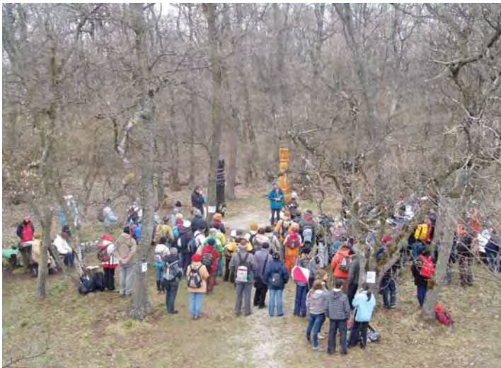
A Pad-kő kilátónál lévő kopjafáknál, a Zala Megyei Természetbarát Szövetség rendezvényén. Lásd 5. oldal FTBE beszámoló