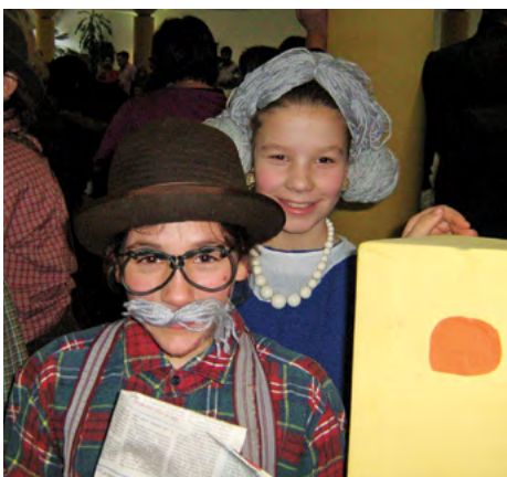
Képes összeállításunk a 2. oldalon