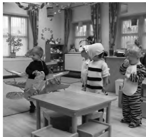
A legnagyobb sikere Matyika repülő jelmezének volt.

2013. április 16-án 9.00 – 11.00 óráig betekintést nyerhetnek a bölcsőde mindennapjaiba, megismerhetik az ott folyó szakmai munkát. Minden kedves érdeklődőt szeretettel várunk!