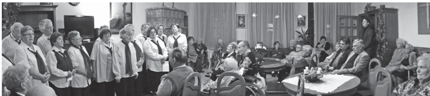
A Nyugdíjasklub 2011. december 12-én, hétfőn este kis előadással, süteményekkel köszöntötte a Kapernaum - szeretoththonban élő időseket, a közelgő Karácsony alkalmából.