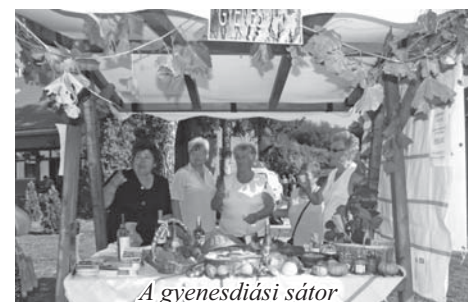
A gyenesdiási sátor

Jövöre a Harkányhoz közeli, ormánsági Diósvizlő látja vendégül a diós településeket.