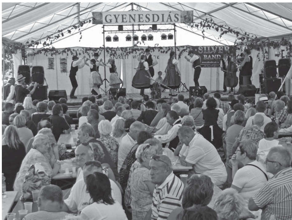
A színpadon a Dunaág Néptáncműhely táncosai és a Pósa zenekar