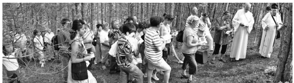
Megható ünnepség – a keresztút – részesei lehettünk

A polgármester köszöntőjében utalt Diás első említésére, majd későbbi történelmére: