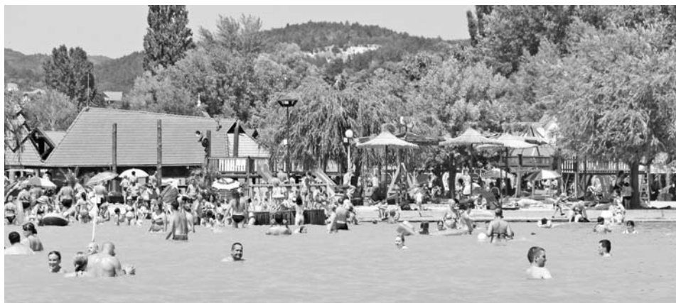
A tavalyi siker után ismét a Diási Játékstrand a Balaton legjobb strandja. Továbbiak a 6. oldalon