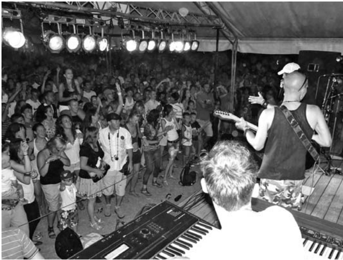
Az Ocho Macho nem csak kitűnő zenét adott, hanem a közönsége is szimpatikus volt