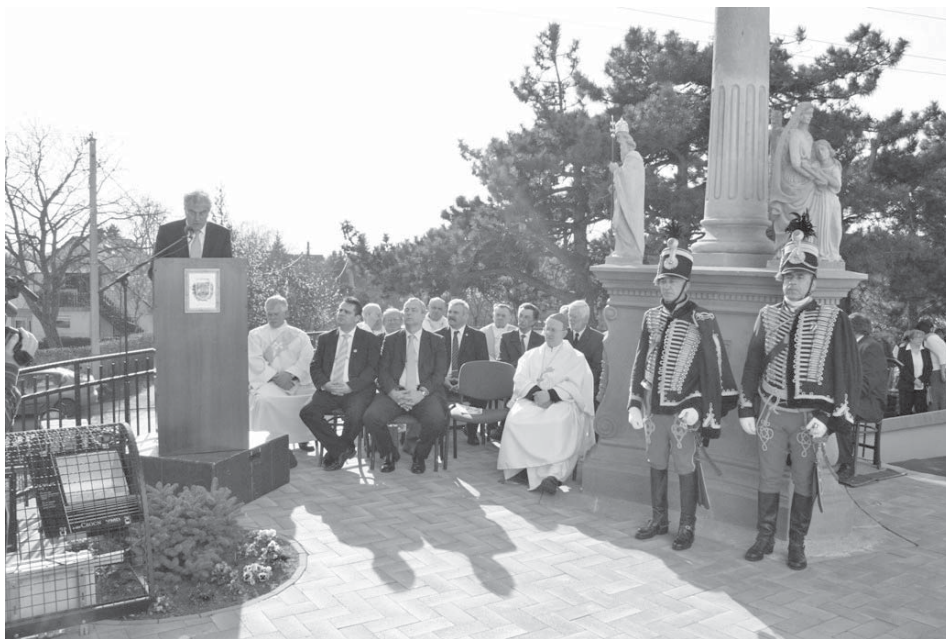
dr. Réthelyi Miklós miniszter beszéde közben