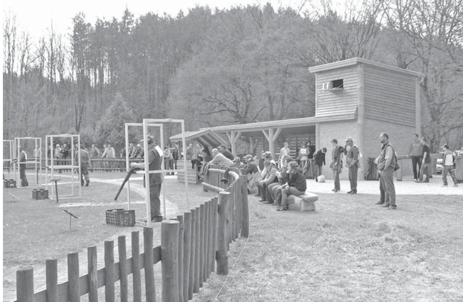
A lőállások, a fedett nézőtér és az új torony

Nagyobb részben a Bakonyerdő ZRt. járult hozzá a költségekhez, kisebb arányban az egyesület a saját pénzéből pótolta a kiadásokat.