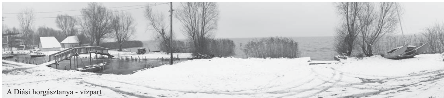
A Diási horgásztanya - vízpart

Wir Bedanken uns für Ihre Zusammenarbeit im Interesse unsere Natur!