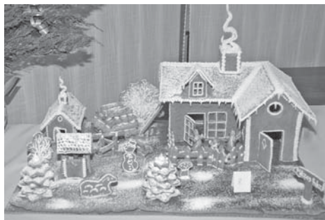
A győztes mézeskalács házikó