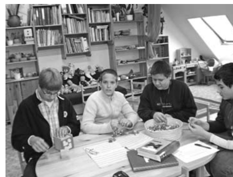
Egykori óvodások (fenn és lent)

Hagyományainkhoz híven november 9-én munka délelőttre hívtuk a szülőket. András napra készülődve közösen munkálkodtunk. Az Adventi és a Karácsonyi ünnepekre