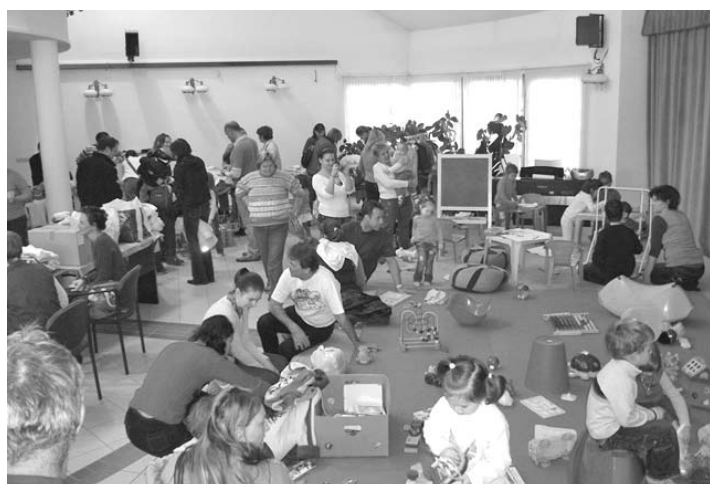
Babavarázs – Használt baba- és gyermekruha vásár