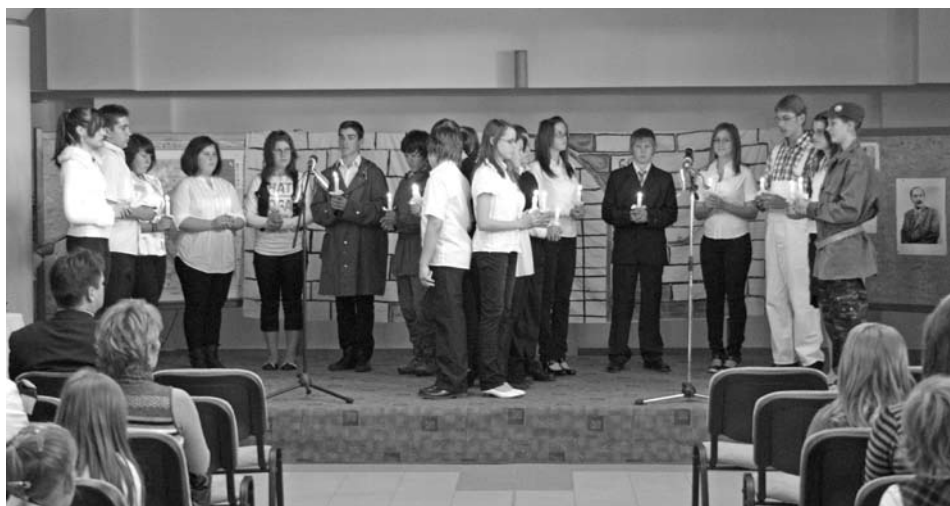
Október 23-i községi és iskolai forradalmi megemlékezésünket október 22-én tartottuk az iskola aulájában, majd átvonultunk az óvodakerthbe, ahol megkoszorúztuk az '56-os emlékművet.

A képviselő-testület következő ülését 2010. november 23-án, 18 órai kezdettel tartja. Az ülés napirendi pontjait ld. fent. A KÉPVISELŐ-TESTÜLETI ÜLÉS NYILVÁNOS.