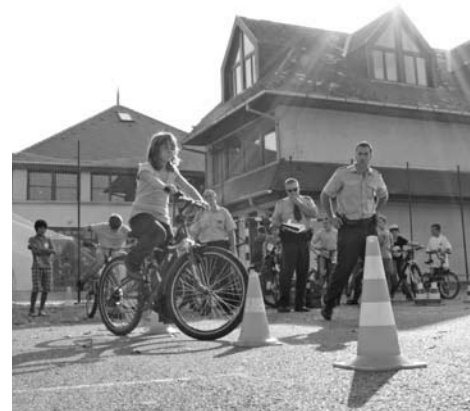
A rendőrök és polgárőrök által rendezett ügyességi versenyen (fent)

Forrásvíz Természetbarát Egyesület, társadalmisításért felelős