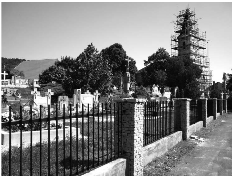
Az új kerítés teljes szépségében látható. A toronysisak fedése folyik.

sor. A javítási, vakolási munkák pedig folyamatban vannak. A templom jobb és bal oldalán álló szobrok restaurálása is megvalósult. A torony gerendázatának teljes cseréje is megtörtént. A bádogos munkák is elkezdődtek. Folyamatban van a sekrestye feletti régi pala leszedése, az elkorhadt tetőlecek, szalufák cseréje.