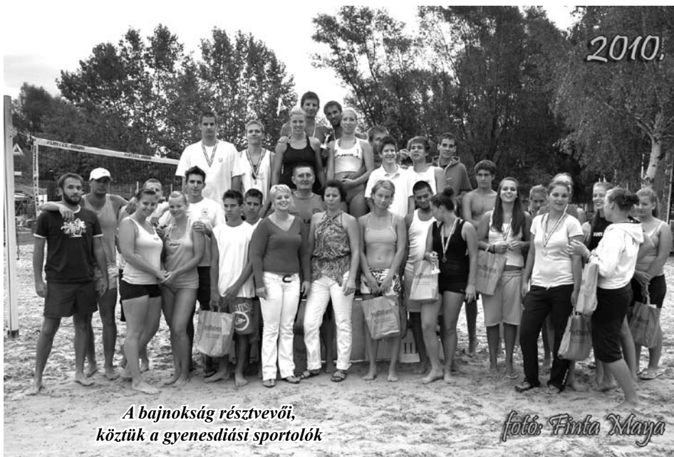
A bajnokság résztvevői, köztük a gyenesdiási sportolók