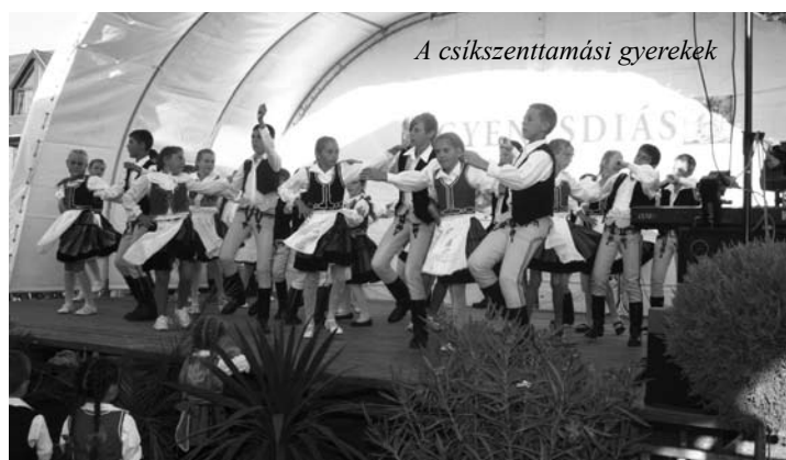
A csíkszenttamási gyerekek